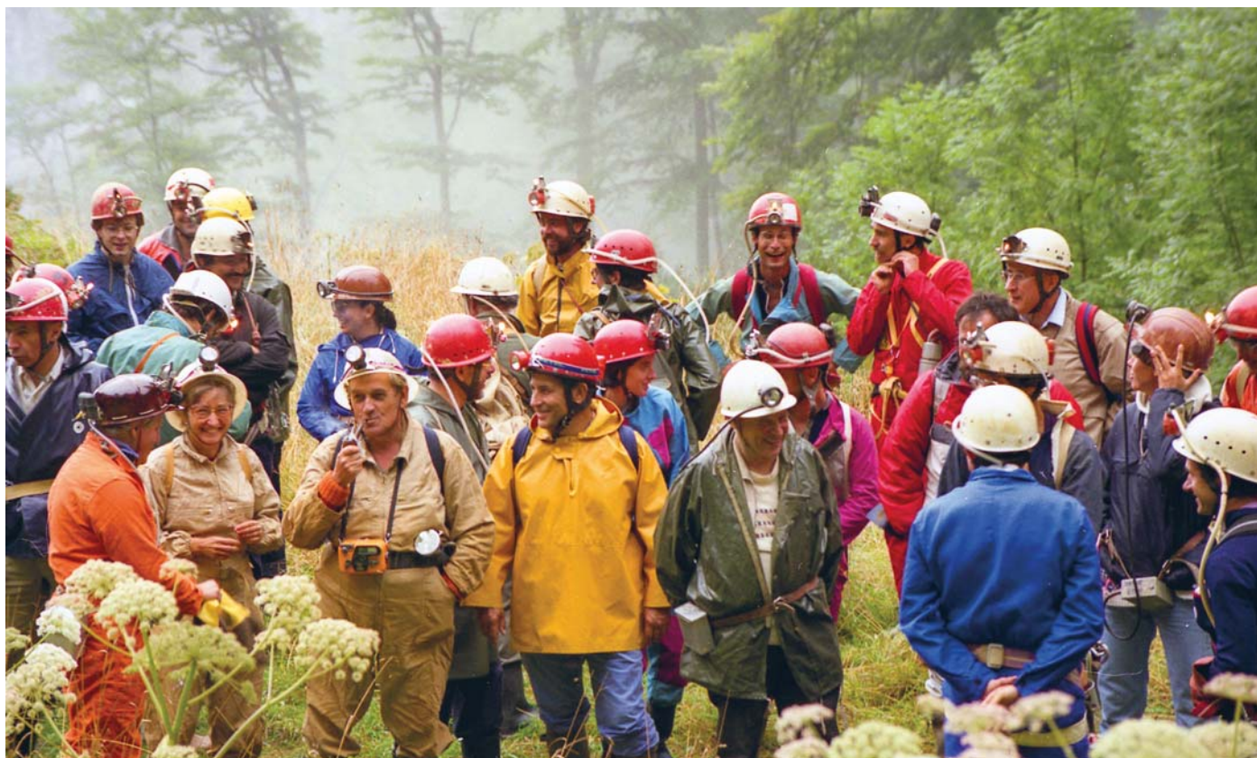
Figure 6 : Les journées de la Pierre Saint-Martin en 1987. Le groupe, ici devant l'entrée du tunnel de Sainte-Engrâce, se prépare à visiter la salle de la Verna et la galerie Aranzadi, qui venaient alors d'être étudiées par Richard Maire et Yves Quinif. The Pierre Saint Martin Days in 1987. The team, located at the entrance of the Sainte-Engrâce tunnel is prepared to visit the Verna Chamber and the Aranzadi Gallery, recently studied by Richard Maire and Yves Quinif.

au colloque ou à l'excursion pouvant atteindre la centaine de personnes.