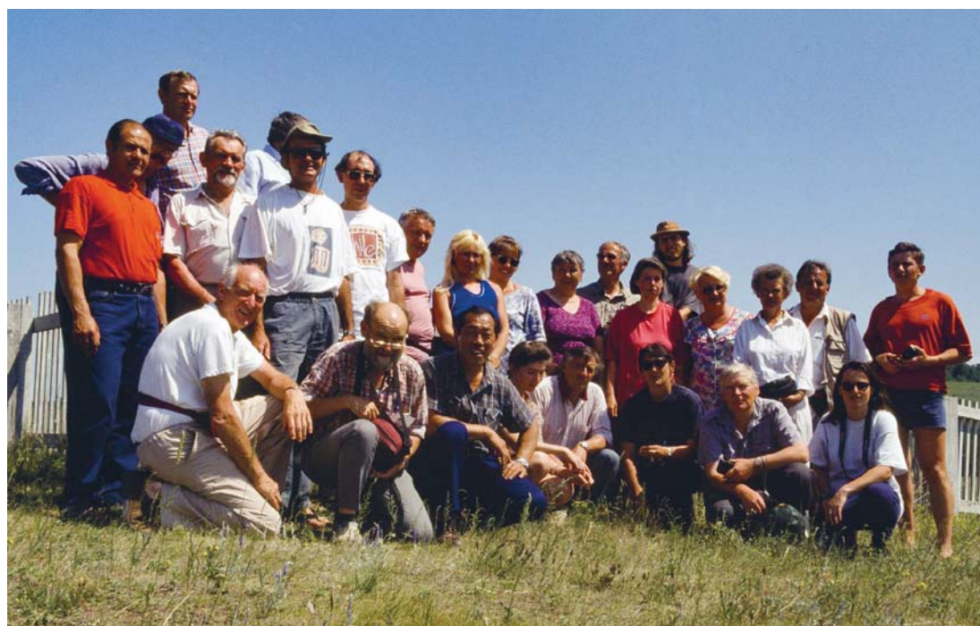
Figure 7 : L'équipe russe, polonaise, slovène et française sur les bords du lac Baïkal lors de la table ronde, en juillet 1996. Round-Table at Baïkal Lake in July 1996, with participants from Russia, Poland, Slovenia, and France.

Depuis une quinzaine d'années, l'AFK a gagné encore en souplesse, jouant véritablement le rôle d'une association loi 1901, indépendante des équipes universitaires, tout en les rassemblant dans un cadre souple et non professionnel. Cette petite association, héritière des sociétés savantes, avec peu d'adhérents et un faible budget, parvient à conserver un dynamisme certain et une bonne visibilité à la fois vers les spéléologues et vers les universitaires. Certaines évolutions nécessitent cependant une analyse: (i) la réduction nette des échanges bilatéraux avec d'autres pays impliquant moins d'excursions à l'étranger; (ii) la réduction depuis une dizaine d'années des publications de la collection Karstologia Mémoires et (iii) un certain fléchissement dans le volume d'articles soumis pour publication dans Karstologia . Paradoxalement, ce constat ne signifie pas forcément une baisse de l'activité « karst » dans le paysage universitaire français. Au contraire, on peut y voir une certaine maturité et une inscription si forte dans les structures institutionnelles, que l'activité de l'AFK n'est désormais que le reflet des