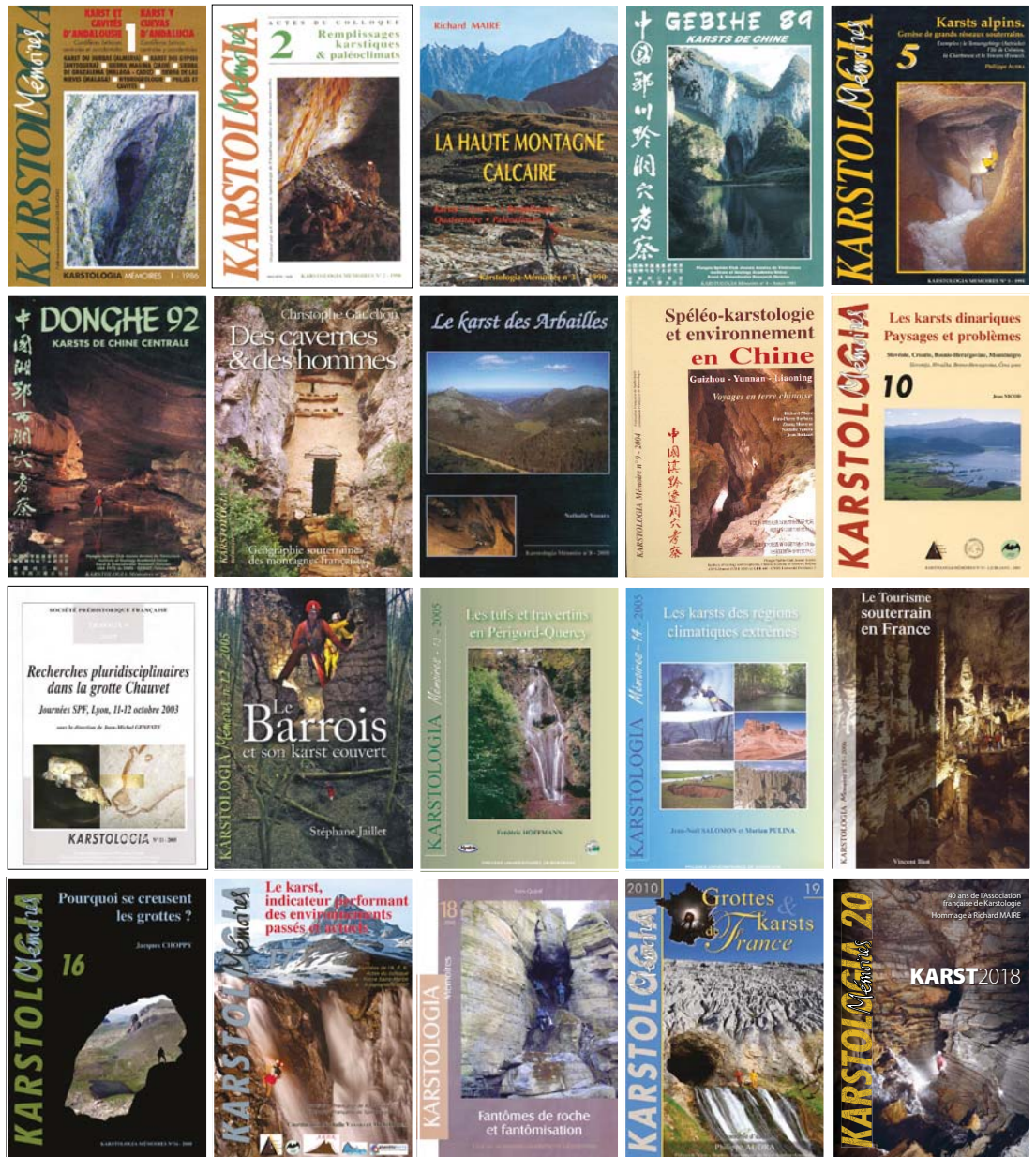
Figure 4 : Les 20 couvertures de la collection Karstologia Mémoires édités sur la période 1986-2018. On compte 6 thèses et une thèse d'État. Les autres Karstologia Mémoires sont des essais, des actes, des synthèses, des comptes rendus d'études ou d'explorations significatives. Covers of the 20 issues of Karstologia Memoires , printed between 1986 and 2018. It contains 6 theses and 1 "Thèse d'État". The other issues are essays, proceedings, synthesis, study reports, or significant explorations.