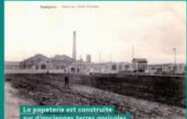
La papeterie est construite sur d'anciennes terres agricoles. Elle restera entourée de champs pendant plusieurs années.