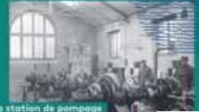
La station de pompage approvisionne l'usine en eau depuis la Seine. Elle amène d'abord l'eau dans un bassin de décantation, puis dans une série de bassins filtrants avant d'être acheminée dans les différentes parties de l'usine.