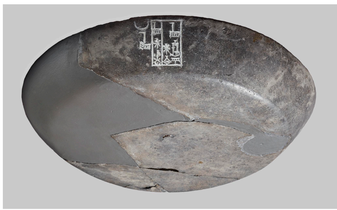
Plat retrouvé dans le « gèpar » d'Ur. Inscription : Enmahgalana. EN [croissant de lune]. BM 118555

L'objectif de cette étude est de réunir l'ensemble des sources écrites (noms d'années, inscriptions commémoratives, documents administratifs, correspondances, textes littéraires), iconographiques (sceaux cylindres, reliefs, statuaire) et archéologiques ayant trait à des prêtres et prêtresses EN en particulier ou à la prêtrise EN en général afin de reconstituer les contours politiques, économiques et culturels de cette fonction et de mettre en lumière son évolution sur le temps long en fonction des villes et des dynasties.