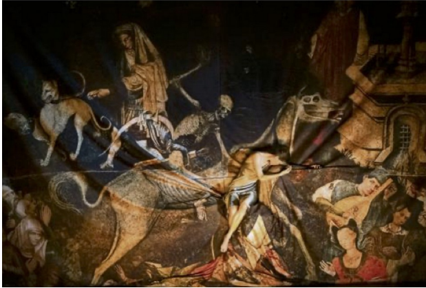
Fig. 8 « Triomphe de la mort » fresque peinte au XVème siècle à Palerme, inspire le chorégraphe Aurélien Bory pour son dernier spectacle en janvier 2024

apparaît de plus en plus réelle et concrète en ce début de troisième millénaire où l'angoisse l'emporte sur l'action salutaire. C'est ici que la création doit émerger entre le totem et le mobile de la pensée. « La faiblesse de toute pensée politique, qui ne s'appuie pas sur l'art, est qu'elle ne sait tout simplement pas comment se rendre sensible. Elle ignore en quelque sorte la situation ». 37