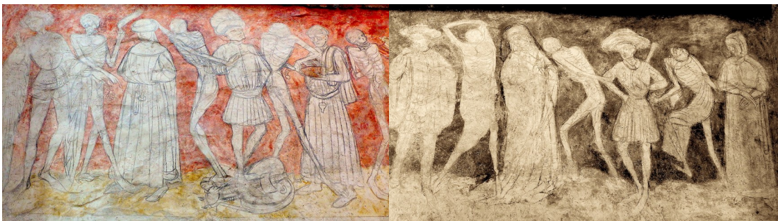
Fig. 6 : Abbaye de La Chaise-Dieu en Haute-Loire - la Danse macabre - XVe siècle