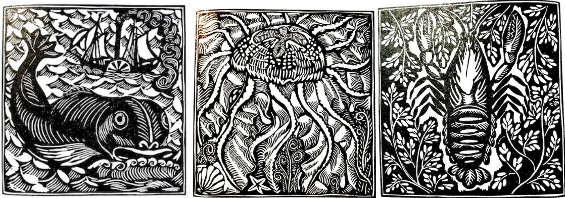
Fig 7 : gravures sur bois André Derain pour le bestiaire de Guillaume Apollinaire 1911

comme des bouteilles vides, des bouées, des filets de pêche ou encore des sacs, mais aussi des milliards de petits éléments pas plus grands qu'un confetti. (...) Si rien n'est fait, il y aura plus de plastiques que de poissons dans les océans en 2050. » 16