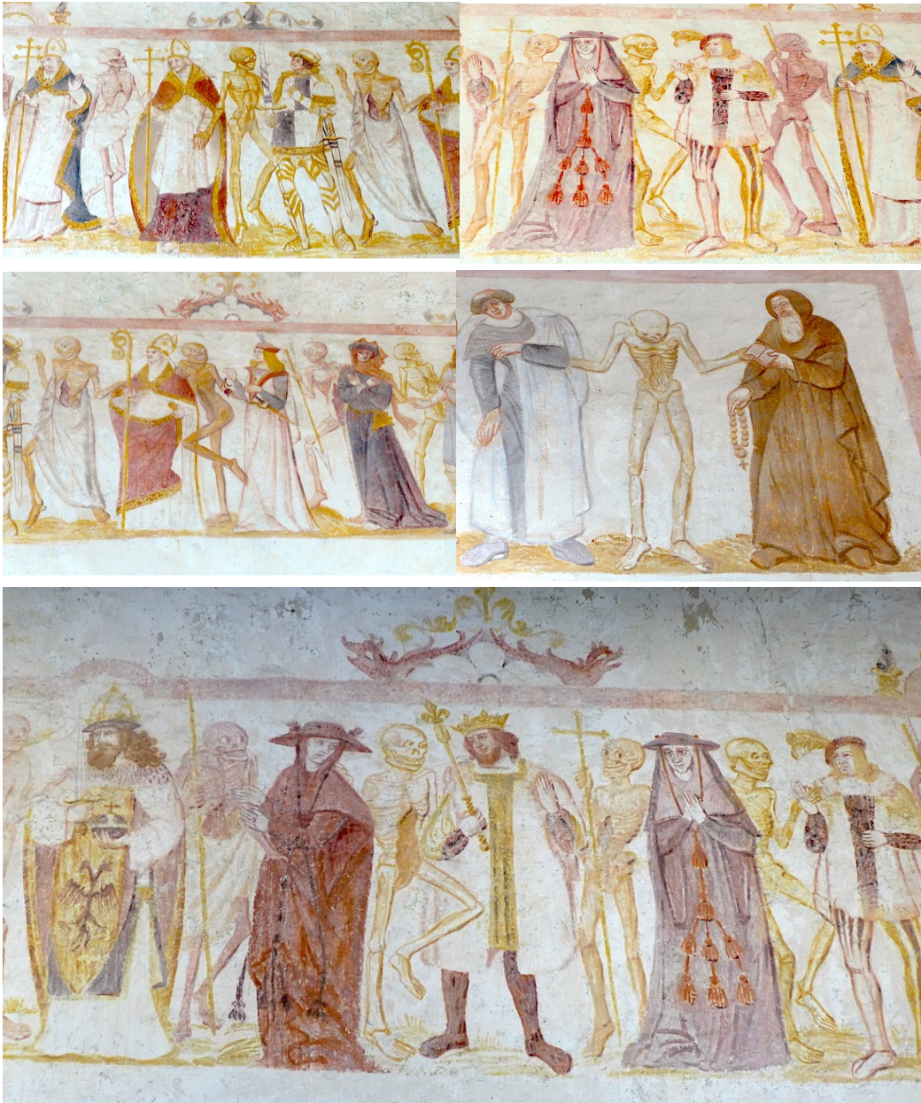
Fig. 1, 2, 3, 4 & 5 : La Ferté-Loupière - Yonne - Eglise Saint-Germain : la Danse macabre (v. 1500)