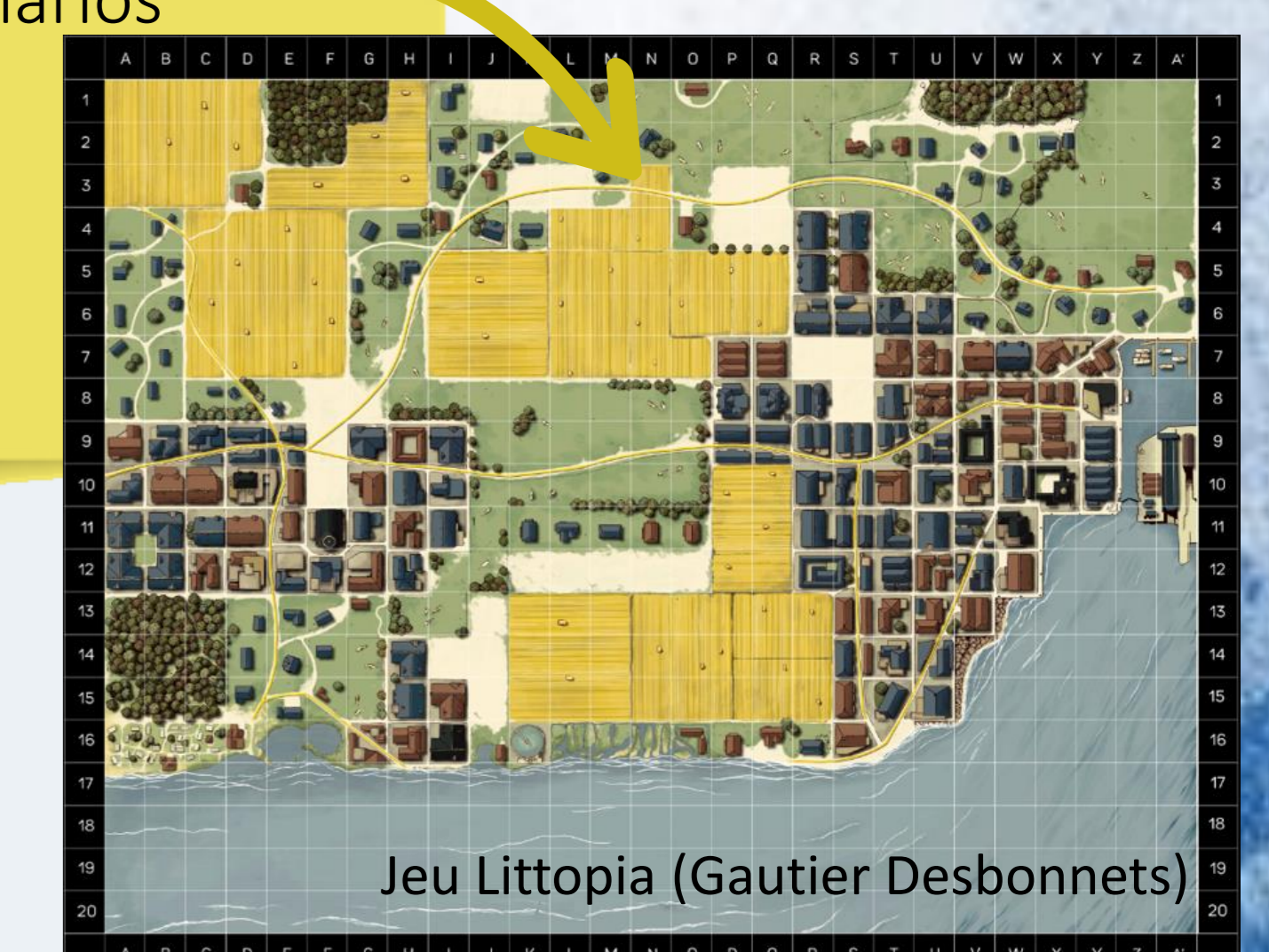
Jeu Littopia (Gautier Desbonnets)