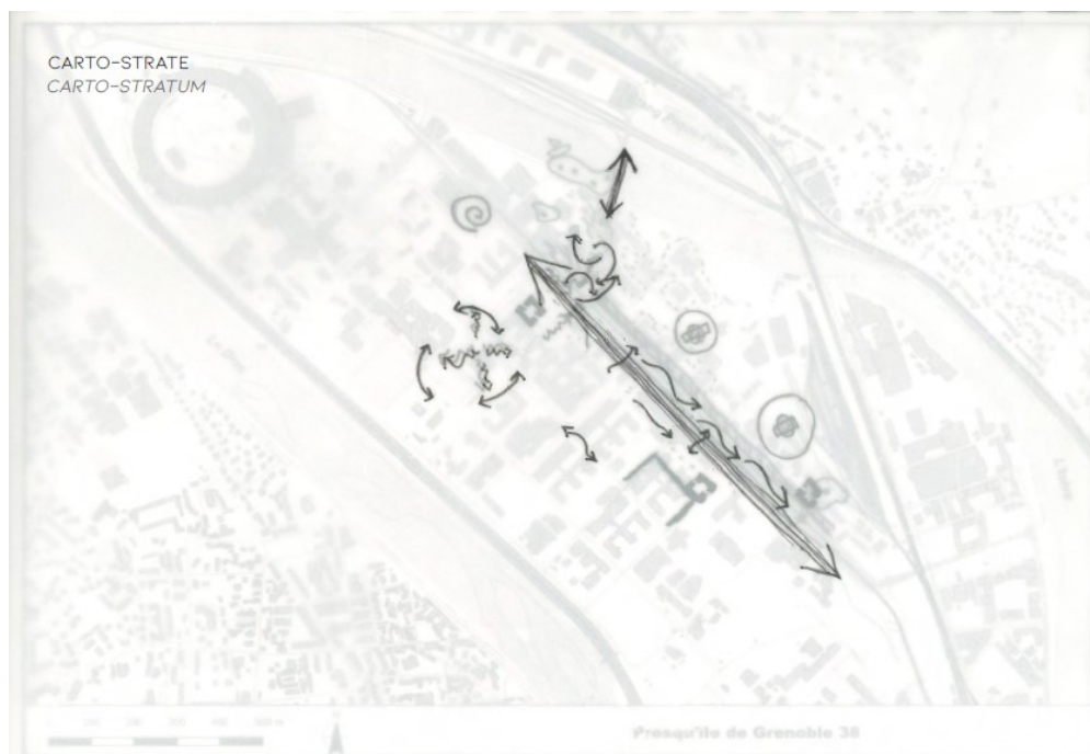
Figure 2 : Une carto-strates sur la base d'une dérive dans le quartier de la presqu'île grenobloise J. Arménio, décembre 2019

Elle peut s'envisager pour des parcours à différentes échelles, de celle d'un tramway (figure 1) à celle de tout un quartier (figure 2).