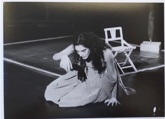
Lê-Anh, Claude, « Photographies de Valse n°6 », Archives personnelles d'Alain Ollivier, Bibliothèque Nationale de France, Paris 1995.