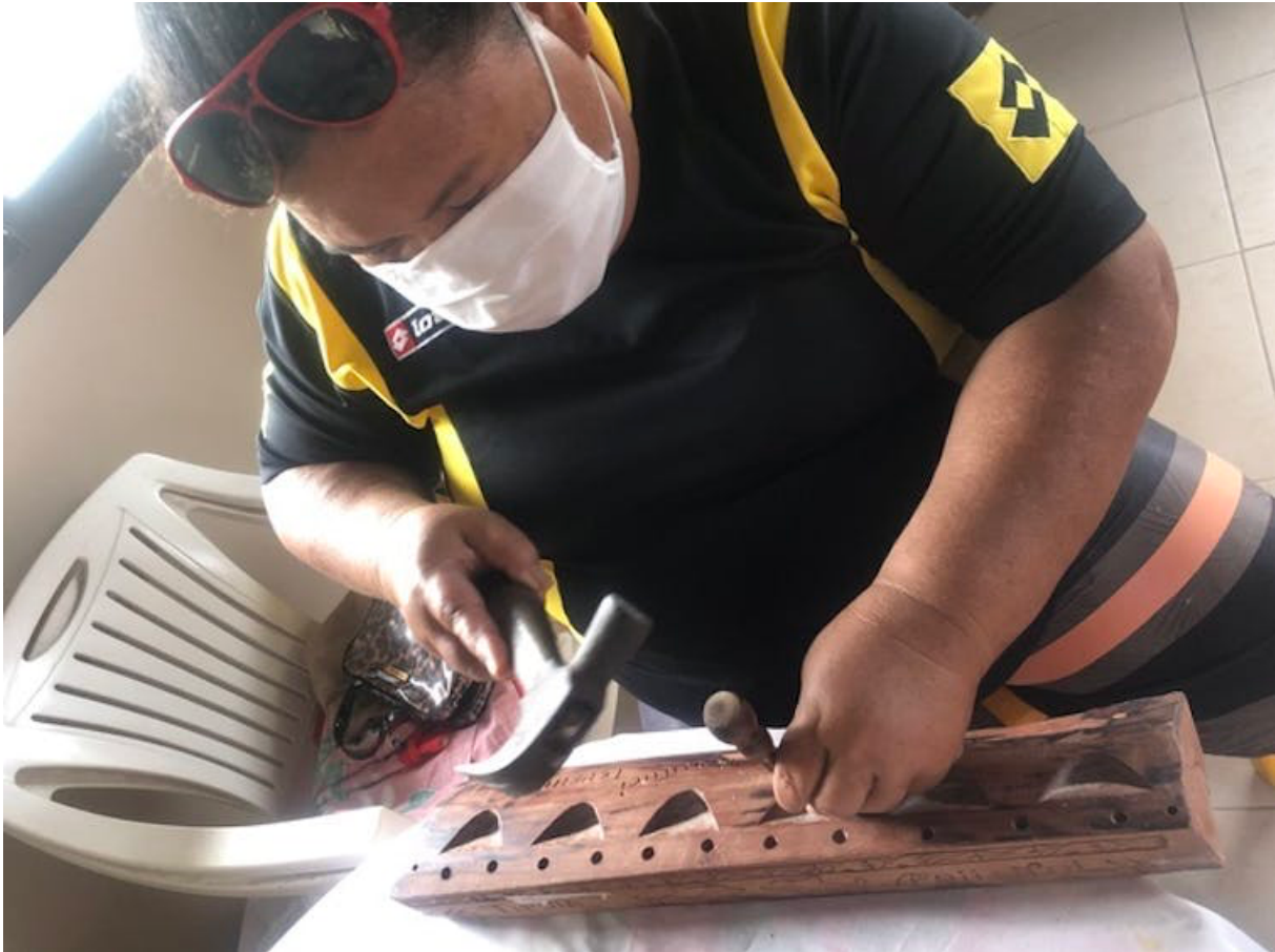
Femme des Tuamotu travaillant le coquillage pour en faire des bijoux ou des objets d'artisanat (Rangiroa, passe de Tiputa). Camille Mazé (juillet 2021)

Mais au-delà de la bonne connaissance de ces coquillages et des lieux où ils se trouvent, ces derniers revêtent également une importance symbolique et historique.