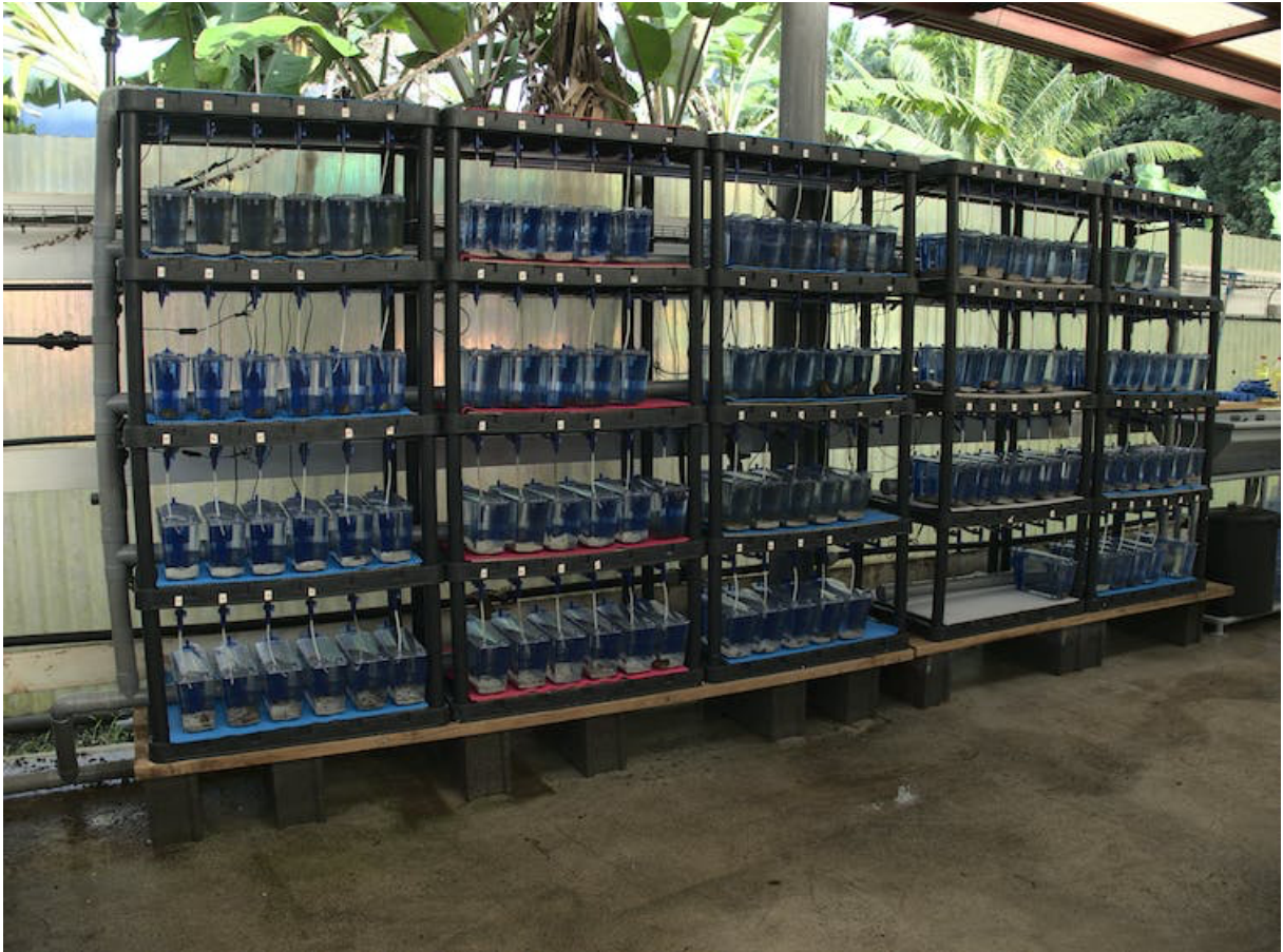
Cônes prélevés dans le milieu naturel et mis en aquarium au Criobe.