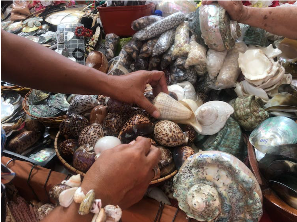
Étal de coquillages sur le marché de Papeete. Camille Mazé (juillet 2021)

dont le pouvoir thérapeutique est jugé important pour le traitement de plusieurs maladies humaines telles que le cancer, les maladies neurodégénératives, l'épilepsie et la gestion de la douleur chronique. Ils pourraient donc devenir un puissant antalgique, avec moins d'effet d'accoutumance que la morphine.