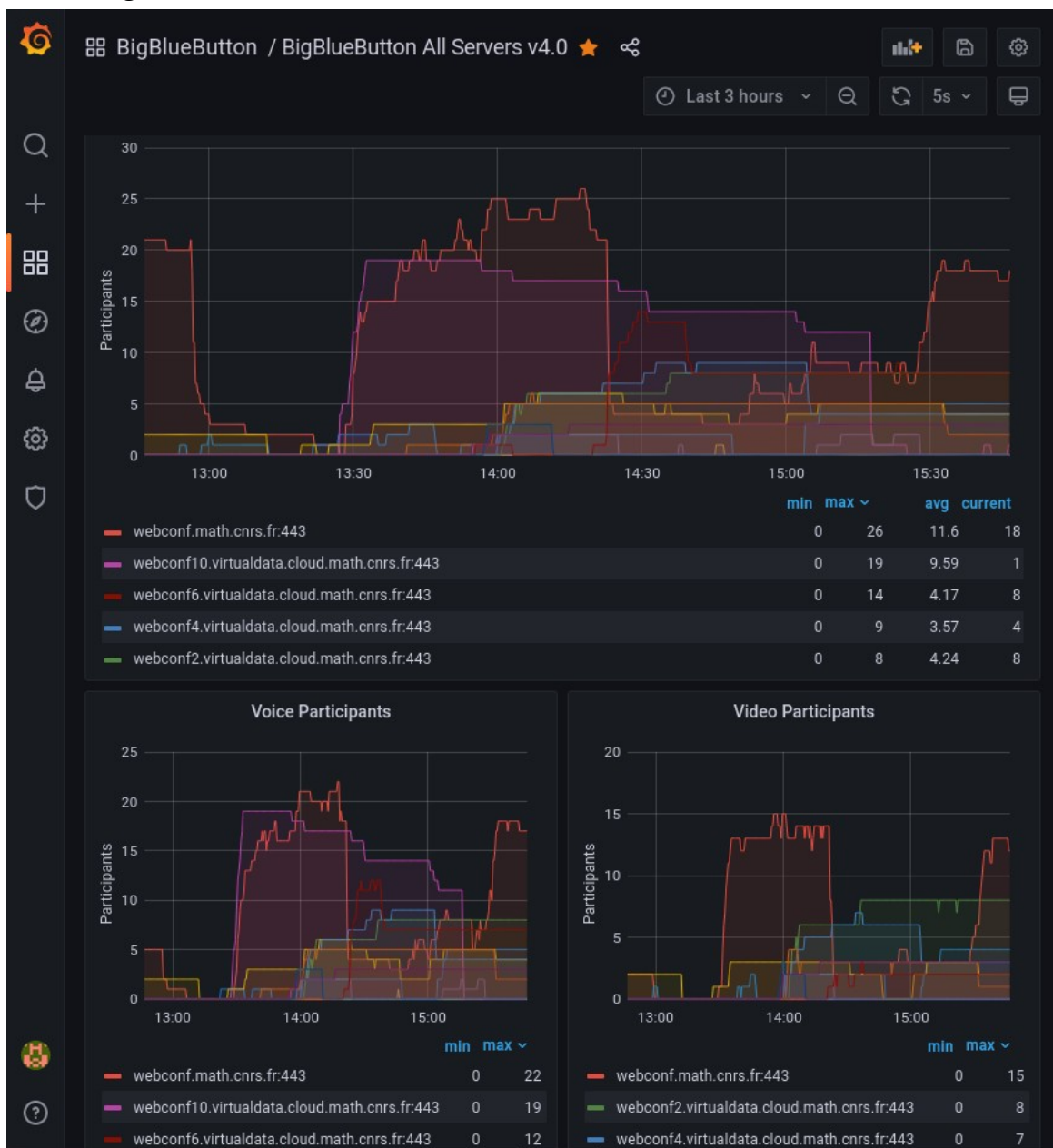
Figure 3 – Copie d'écran du monitoring de nœuds BBB

Toutes les métriques sont maintenant collectées par deux serveurs Prometheus, un sur chaque site cloud, l'affichage étant confié à Grafana.