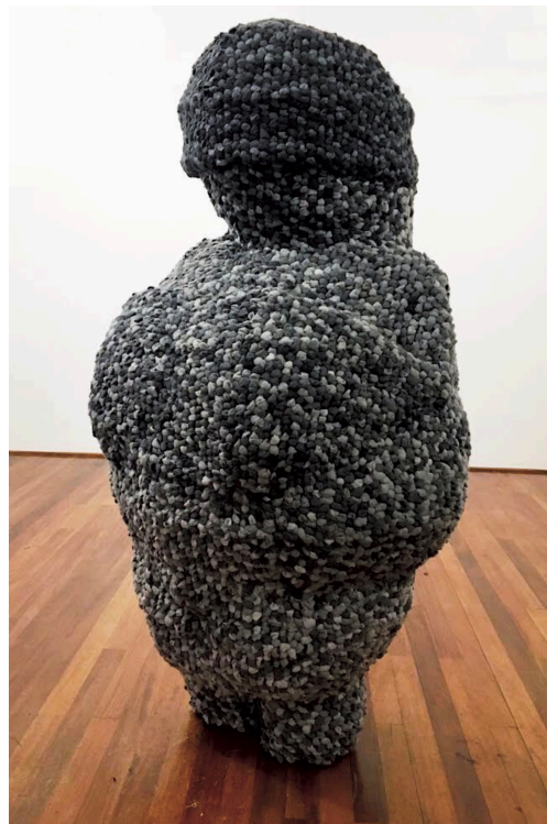
Fig. 7. Venus , Rustha Luna Pozzi Escot, 2019

pieza de gran formato que retoma la morfología de la Venus de Willendorf. 14 Esta pieza está construida con una estructura de metal, la cual está revestida por una cantidad considerable de nudos de alpaca. El soporte es una red cuadrículada de metal sobre la cual se anuda en cada intersección un punto. El textil, presente en esta pieza, nos recuerda que es nuestra segunda piel y nos acompaña desde tiempos inmemoriales. Me interesa trabajar con materiales de recuperación, en este caso la materia textil utilizada para esta pieza son los sobrantes “merma” de una fábrica de Alpaca local 15 . Fue un trabajo de tejido en la superficie de esta escultura utilizando una técnica híbrida, intersección entre el tapiz y el punto cruz.