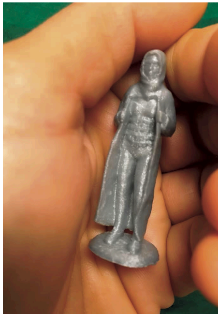
Fig. 8. Amuleto , Rustha Luna Pozzi Escot, 2019