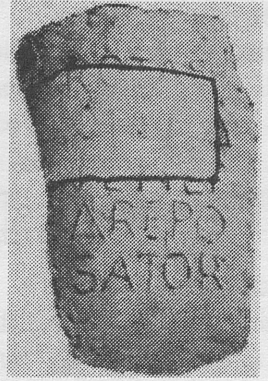
ROTAS de Manchester

de l'alpha et de l'oméga, tirés du Livre de l'Apocalypse (1, 8). 1 Mais il est loin d'être évident que l'origine du palindrome soit chrétienne puisque, si l'Apocalypse attribuée à saint Jean a été écrite par lui à Pathmos (Dodécanèse) sous le règne de Domitien – ce qui est l'opinion des plus sérieux exégètes 2 – elle ne se situe pas avant l'an 95, et que, même si certaines parties ont été rédigées par un autre auteur dès le temps de Néron un peu avant 70, le document n'aurait sans doute pas pu atteindre Pompéi avant 85 ou 90, c'est-à-dire après la date de son ensevelissement sous les cendres volcaniques. Il est clair aussi que l'usage, à cette époque, n'était pas d'introduire des lettres latines (A et O) pour figurer des lettres grecques : si \alpha majuscule s'écrit bien A, \omega majuscule s'écrit \Omega .