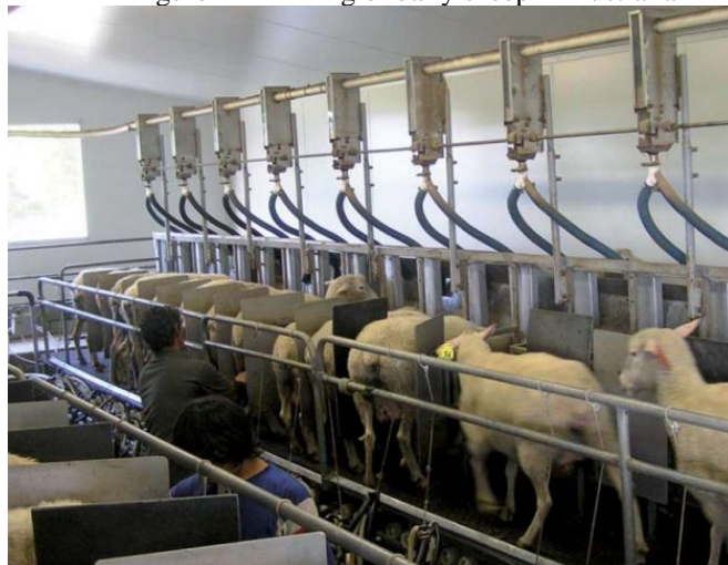
Figura 2 – Ordenha de ovelhas leiteiras na Austrália Figure 2 – Milking of dairy sheep in Australia