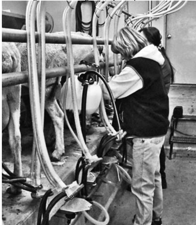
Figura 1 – Ordenha de ovelhas leiteiras nos Estados Unidos Figure 1 – Milking of dairy sheep in United States