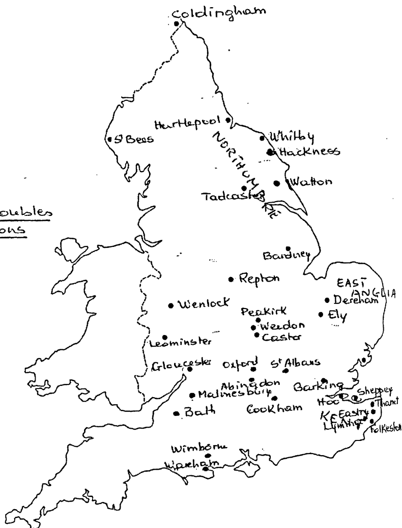
Figure 1 : Monastères doubles anglo-saxons