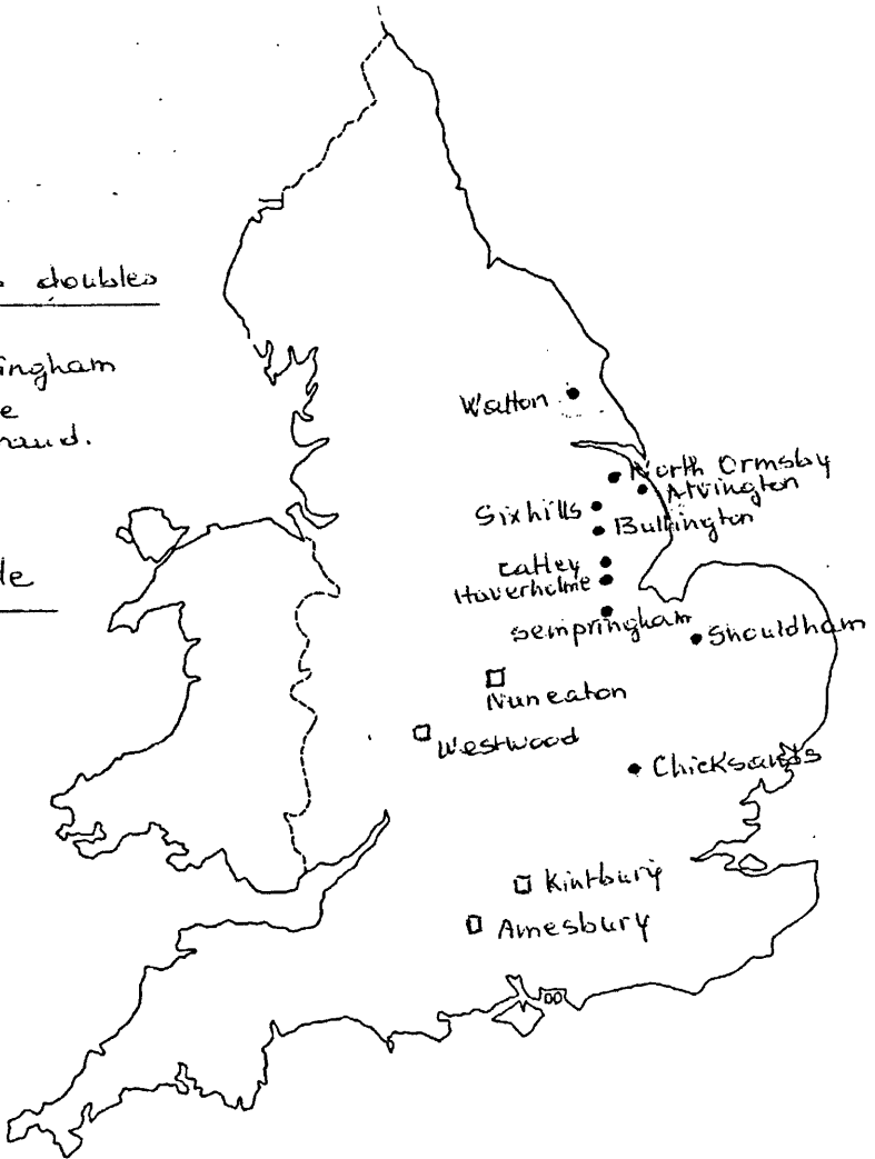
Figure 2 : Monastères doubles au XII e siècle