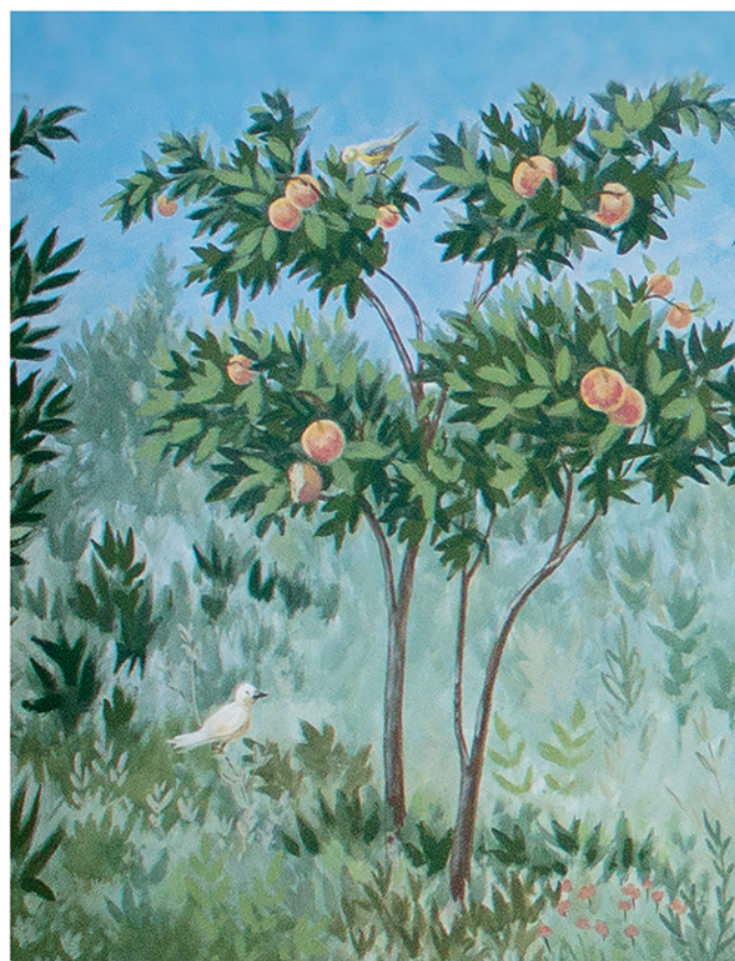
Décor peint d'après les fresques de la Villa di Livia-Rome (détail), V. Fichaux® (exposition "Habiter Forum Iulii").

La Revue du Centre Archéologique du Var a pour but de promouvoir l'histoire et l'archéologie locale, l'étude et la protection du patrimoine varois et de la région PACA en diffusant les résultats d'opérations archéologiques, de programmes de recherches ou d'études spécialisées. Elle apporte un soutien éditorial aux membres actifs de l'association, aux étudiants et chercheurs qui le souhaitent sous la forme d'article ou de notices d'information.