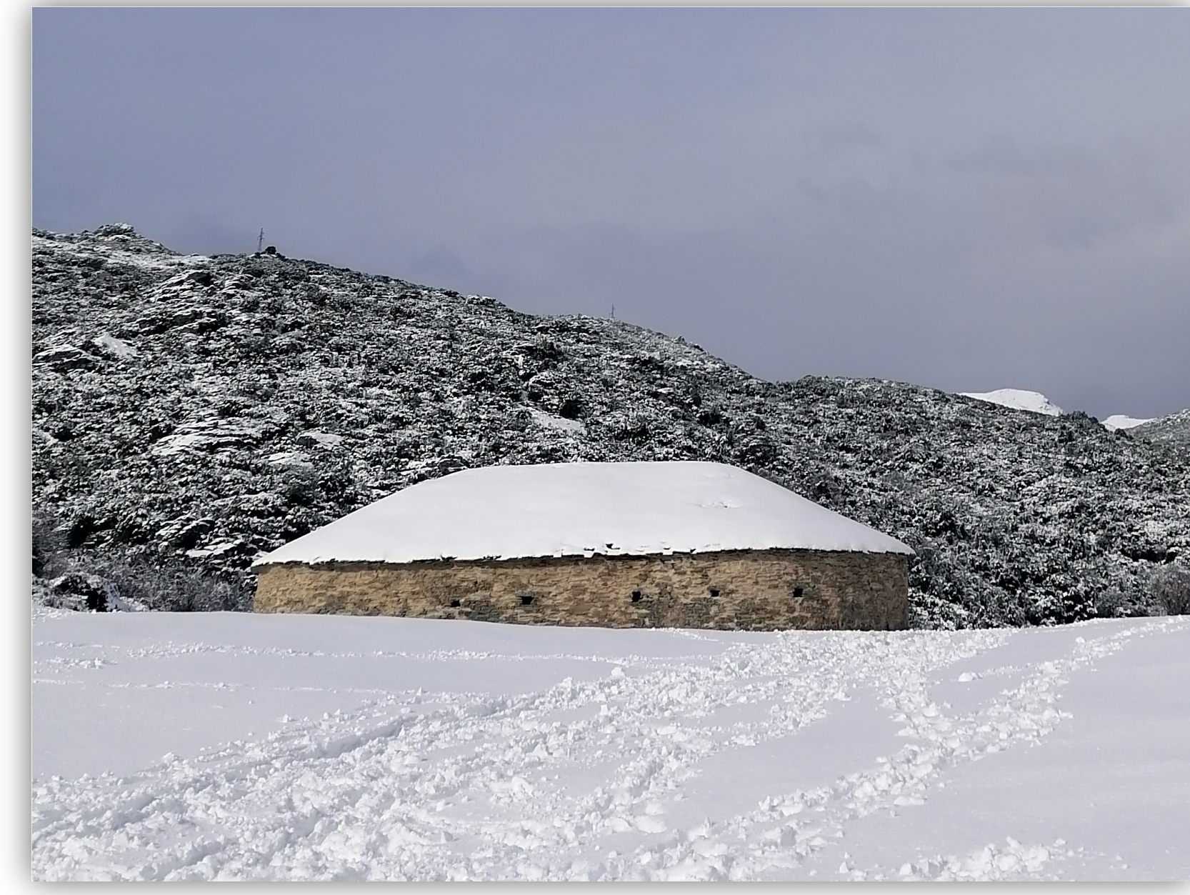
Nivière de Bocca Pruna (Haute-Corse) en janvier 2023