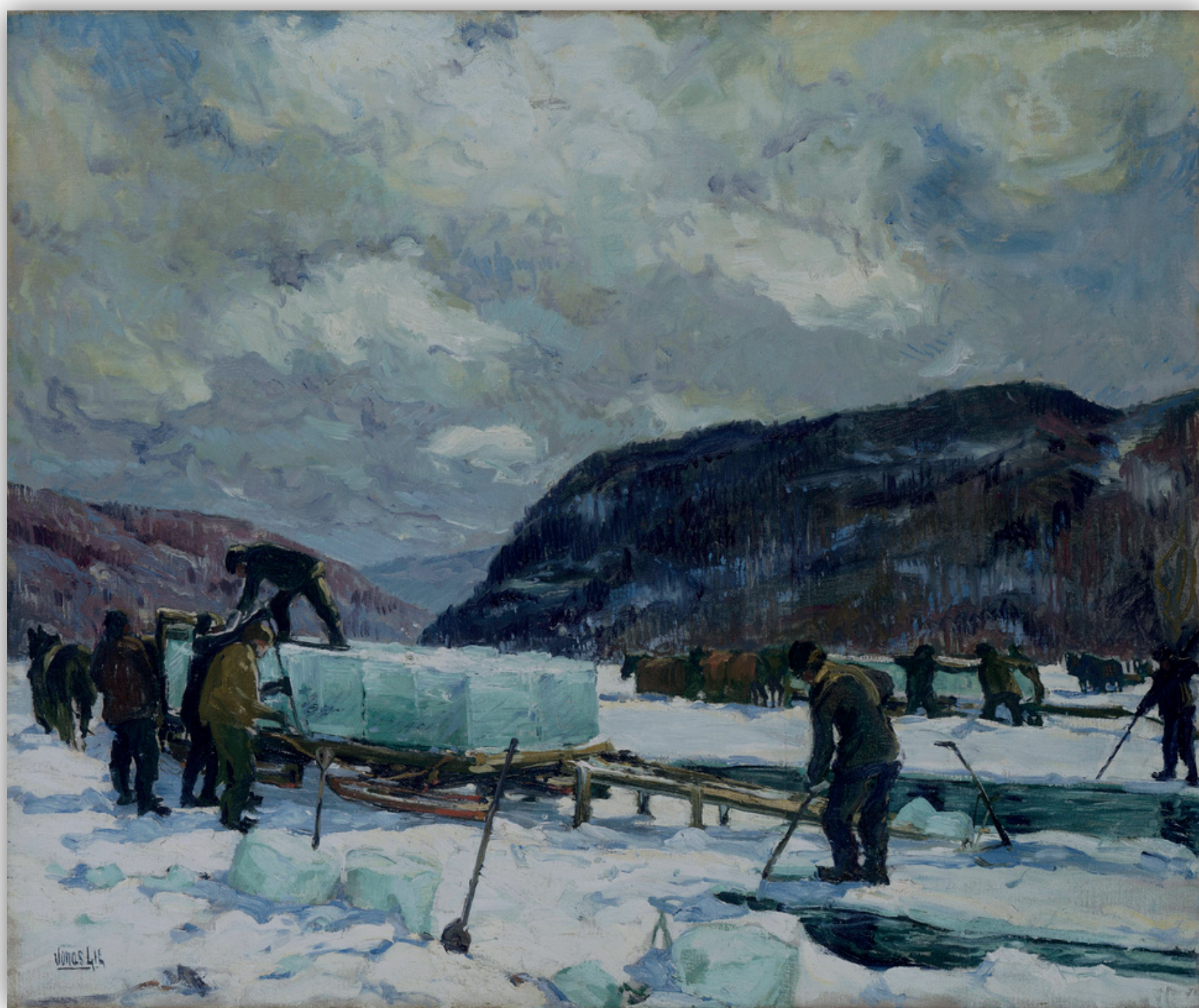
Ice harvest, Jonas Lie, 1880, huile sur toile

En Méditerranée, neiges et glaces ne se produisent pas de la même manière. La neige se récolte ou se « cueille » dans des « champs de neige » : replats où les vents convergent et où la neige s'accumule.