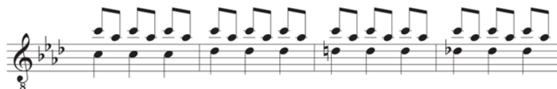
Interludio de "El hombre". Transcripción tomada de Rojas, "Sonido, religión y Nueva Canción Chilena", 274.

hasta el final. Las características particulares del interludio recaen en el uso de un ostinato melódico descendente (do – lab) y un cromatismo (do – reb – re \sharp – reb), los cuales no se utilizan en ninguna otra parte de la canción (ver figura).