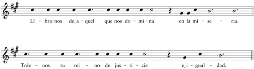
Comienzo del estribillo de "Plegaria a un labrador". Transcripción sin ritmos.

Ambas referencias bíblicas resaltan por relacionar la flor con el soplo-viento y funcionar como imágenes de la transitoriedad de la vida humana. Para Pring-Mill resulta claro que Jara no intentaría expresar esta idea. No habría, en este sentido, una relación textual. Pero Pring-Mill propone que sí habría una referencia contextual y más general en la que el labrador al que se dirige la canción estaría llamado a emular el espíritu (el soplo, aliento) del Dios, cuyo soplo, como aparece en Isaías, seca la hierba y marchita la flor. 573