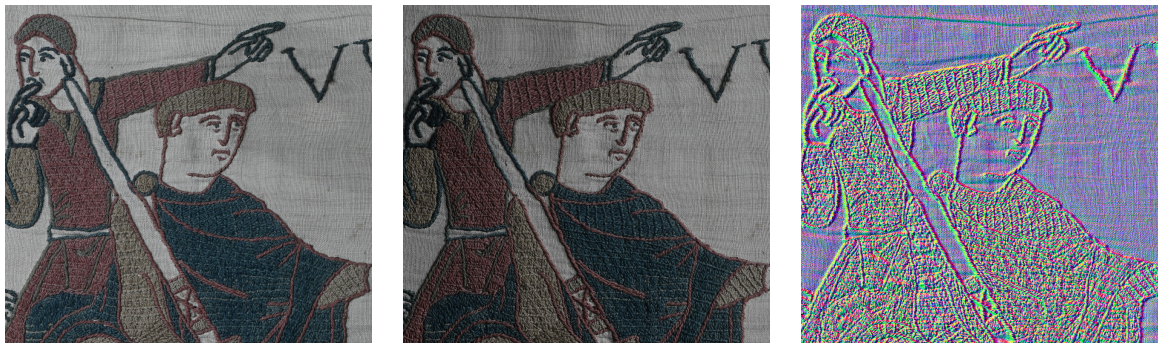
FIGURE 1 : Reconstruction 3D d’une surface mate en utilisant l’approche classique des problèmes inverses. À gauche : deux photographies d’une scène de la Tapisserie de Bayeux, prises sous deux conditions d’éclairage différentes. À droite : la reconstruction 3D, présentée ici sous forme de carte de normales, met en évidence la finesse des fils de cette broderie. Un tel résultat est obtenu très efficacement et est physiquement interprétable, cependant, la méthodologie sous-jacente ne peut pas gérer les surfaces très brillantes.

Traditionnellement, ce problème a d’abord été résolu par l’inversion numérique d’un modèle physique paramétrique, produisant des solutions peu gourmandes en ressources et interprétables pour la reconstruction des structures fines de surfaces bien approchées par le modèle de réflectance Lambertienne pour les surfaces mates (Figure 1). Cependant, ces dernières années ont vu un virage vers des approches basées sur l’intelligence artificielle, où les architectures de réseaux neuronaux apprennent directement l’association entre les images et la géométrie à partir d’ensembles de données massives. Bien que de telles méthodes excellent dans la reconstruction du relief pour les surfaces très réfléchissantes (Figure 2), elles posent des défis en termes de besoins en ressources et d’interprétabilité, car les modèles de réflectance sont implicitement encodés de manière opaque dans les nombreux coefficients du réseau.