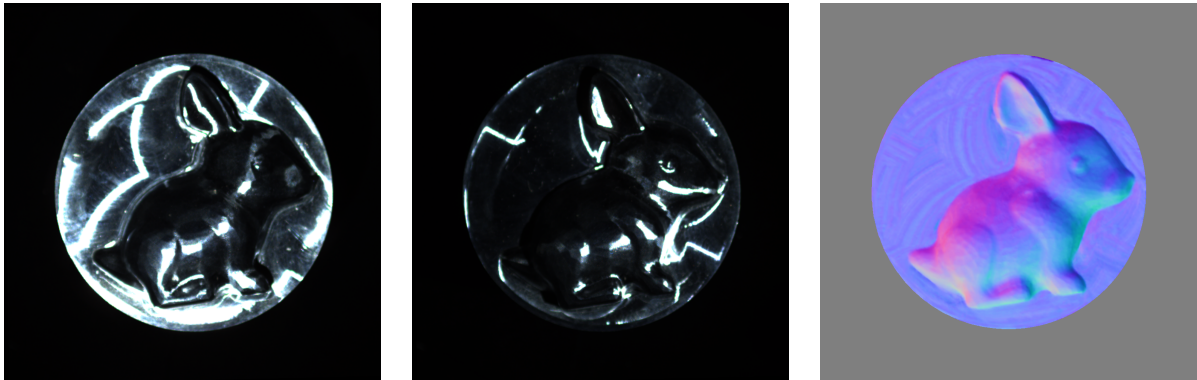
FIGURE 2 : Reconstruction 3D d'une surface très brillante en utilisant l'approche neuronale. À gauche : deux photographies d'un lapin en aluminium. À droite : malgré le comportement spéculaire de la surface, la reconstruction 3D est très précise. En revanche, le résultat n'est pas physiquement interprétable, et l'obtenir nécessite des données d'apprentissage massives et une puissance de calcul importante. Source des images : [2].