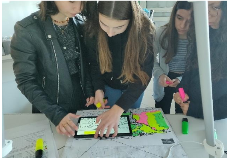
Fig. 3. Matériel fourni : marqueurs et tablette avec/sans SPART selon le type de groupe. Ici : groupe avec SPART

des fils). Le résultat de la trilatération mécanique est ensuite envoyé à l'appareil connecté qui peut afficher la couche d'augmentation en fonction de sa position physique. Cette version de SPART coûte 50 € et permet d'augmenter une feuille A3 avec une précision moyenne de 0,5 cm et un taux de rafraîchissement de 20 Hz [8].