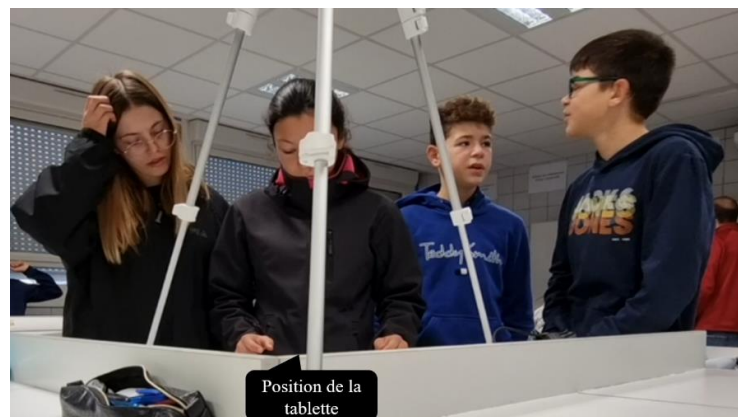
Fig. 4. Deux filles avec SPART pendant que les deux garçons ont une conversation hors sujet.

SPART semble fonctionner comme un repère visuel pour les membres du groupe qui sont concentrés sur une tâche personnelle ou à des activités sans lien avec l'activité principale. En effet, après avoir interrogé l'un des élèves de 4-SPART, celui-ci a souligné le rôle de SPART pour l'aider à suivre l'activité de ses coéquipiers à distance, à la fois pendant les phases de coopération et lors de la transition vers les phases collaboratives.