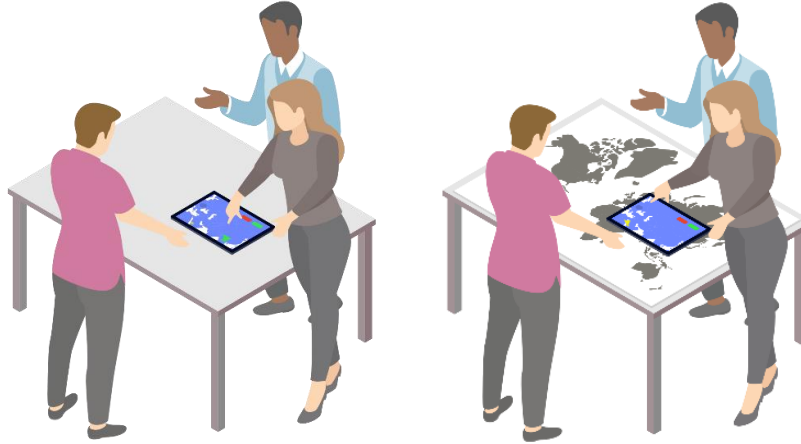
Fig. 1. SPART, une interaction peephole dynamique horizontale (droite) d'augmentation de support et l'interaction peephole statique (gauche)

Ce dernier type d'interaction, notamment en configuration horizontale , comme présentée sur la figure 1 (droite), semble particulièrement prometteur dans le contexte du MCSCL. En effet, il offre des conditions similaires à une table interactive, mais mobile et à bas coût, puisqu'il utilise simplement un support physique pliable, comme une carte, ainsi qu'un smartphone ou une tablette. Nous nommons ce type d'interaction SPART , abréviation de on-Surface Positioning for Augmented Reality .