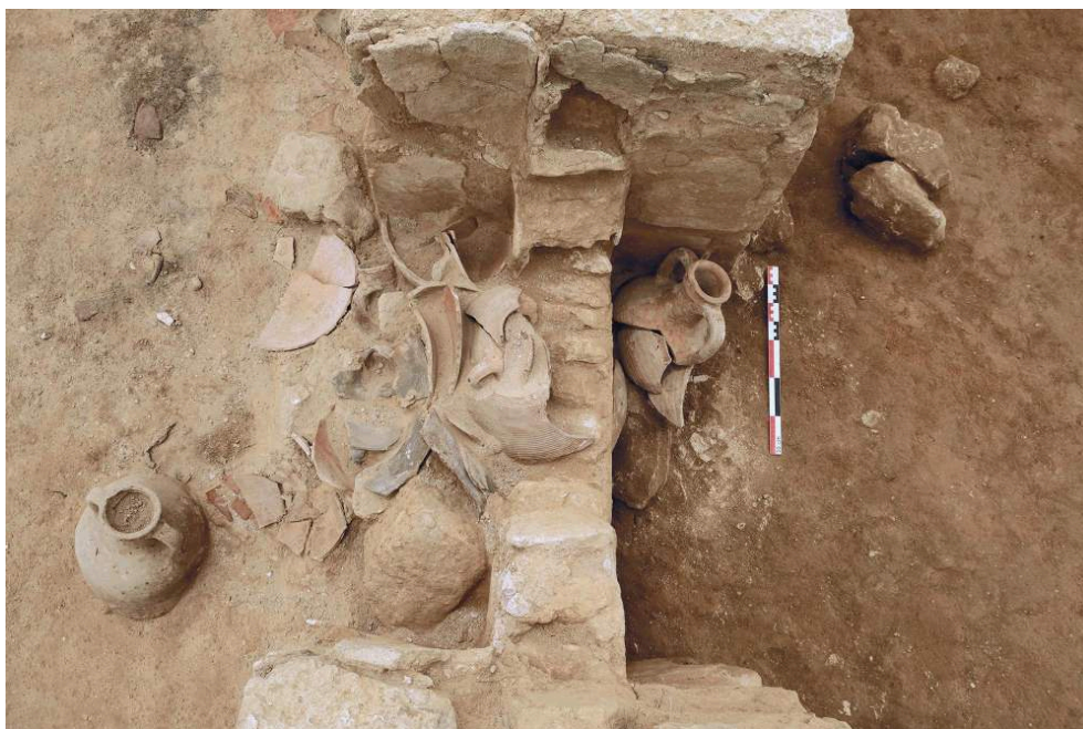
Fig. 7. Le dépôt amphorique dans le New Building . Vue zénithale depuis le sud.