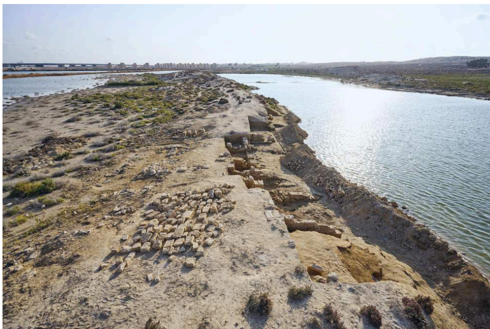
Fig. 8. Vue générale de la zone 1 du secteur 23 en fin de fouille depuis l'est.

permettent cependant pas de préciser la fonction exacte de l'entrepôt. La présence de nombreux tessons d'amphores suggère un stockage de récipients vinaires. L'ensemble paraît avoir été rapidement abandonné puisque les bâtiments furent recouverts par l'installation de la digue artificielle qui semble avoir eu lieu après le début du III e s.