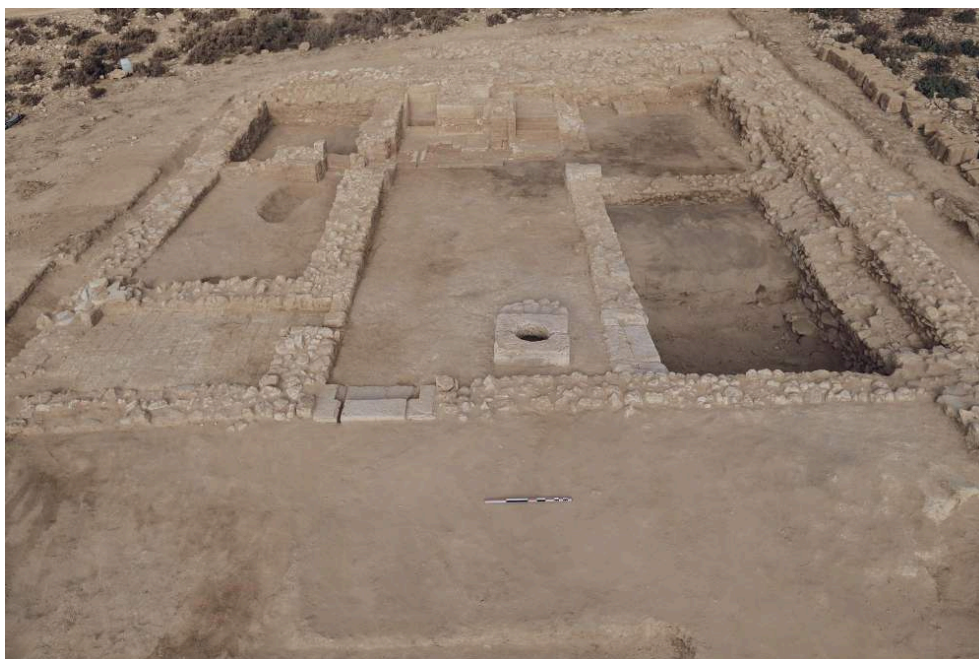
Fig. 2. Partie occidentale du BAT 1201 en fin de fouille depuis l'est.