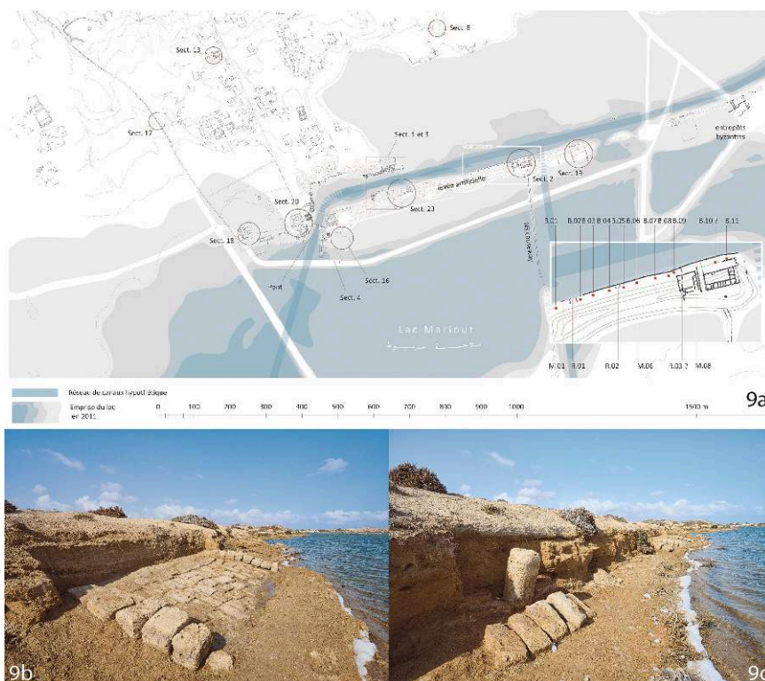
Fig. 9a. Plan de localisation des bornes d'amarrage, rampes et murets sur la levée du lac Mariout (P. Piraud-Fournet 2023, sur un fond de plan de T. Fournet) ; b. Rampe R. 01 (M. Kačičnik) ; c. Borne d'amarrage B.03 (M. Kačičnik).

probablement destinée à tirer les navires du canal à la terre sèche (fig. 9). Les bornes d'amarrage sont mises en œuvre à partir de colonnettes ou de piliers (calcarénite, granit, calcaire coquiller) réemployés.