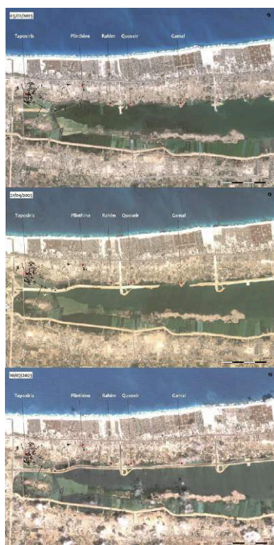
Fig. 6. Évolutions de la construction du nouveau réseau routier le long du lac Mariout entre février et juillet 2023 (MOM, J. Caverio d'après Copernicus Sentinel Data 2023).