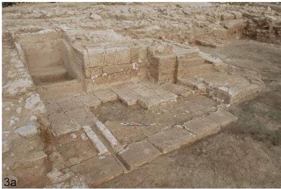
Fig. 3a-b. La salle de bains PCE 1211, vue du sud-est et proposition de restitution (MFTMP, P. François).