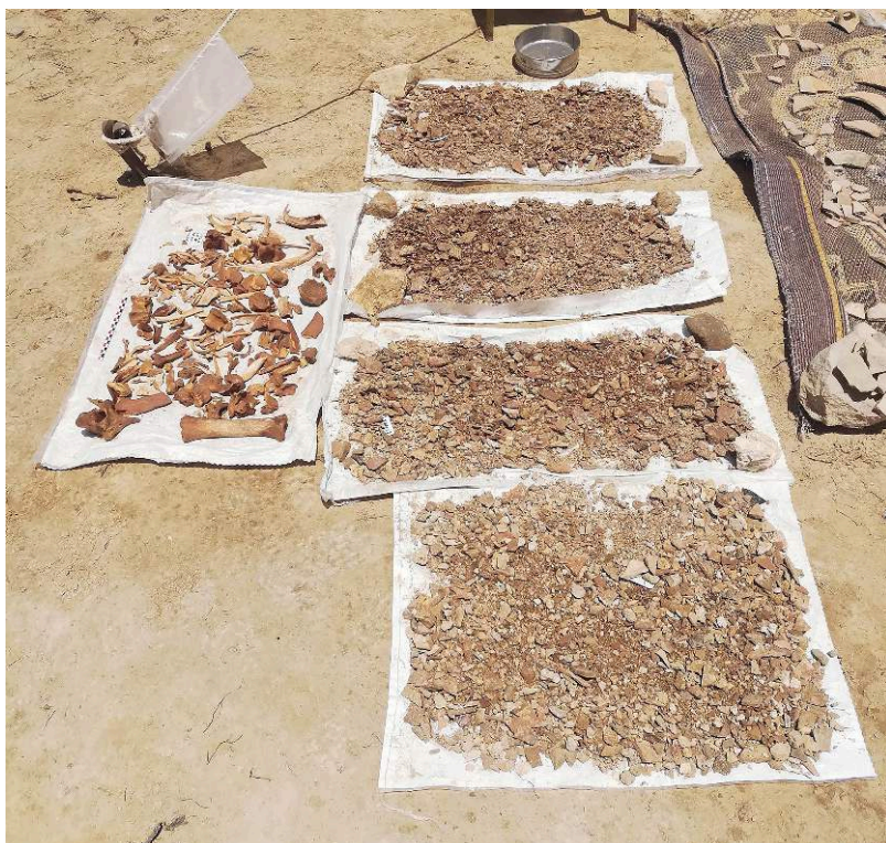
Fig. 10. Dépotoir de BAT 2004. Lots d'ossements collectés manuellement (à gauche) et échantillons tamisés (à droite).