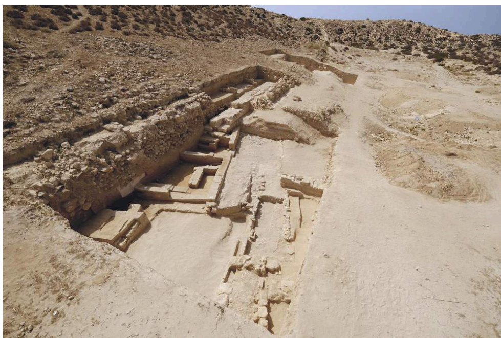
Fig. 1. Le sondage 10 au centre du kôm de Plinthine.