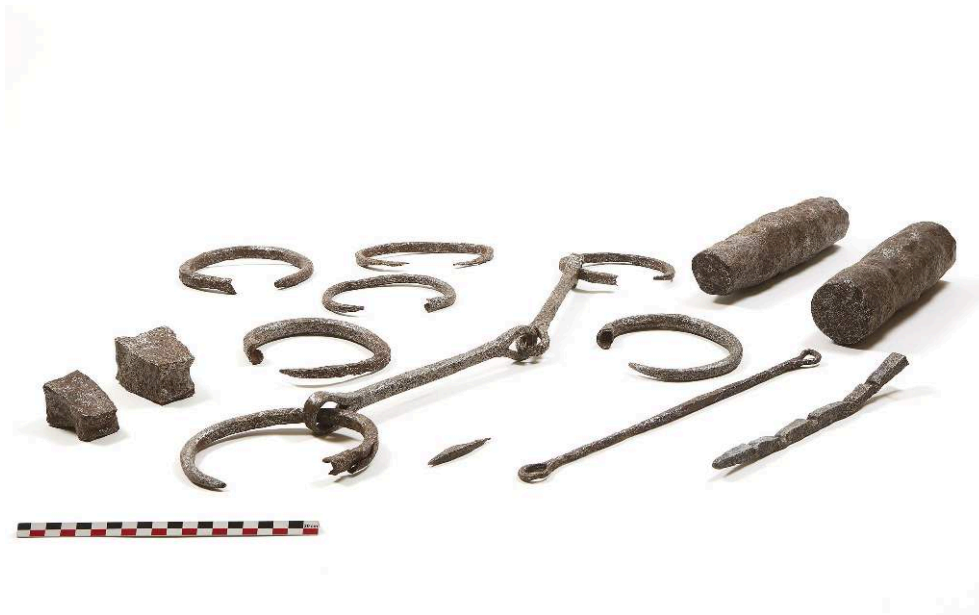
Fig. 5. Sélection d'objets en fer découverts en 2022 dans les secteurs 33 et 44 de Ghozza : entraves, fragments d'outils, lingots ou pilons de fer (M. Kačičnik).