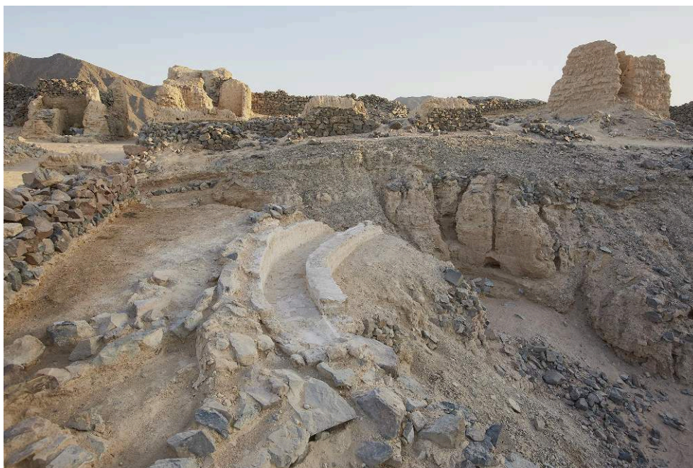
Fig. 8. Canal relié au puits de Deir el-Atrash (M. Kačičnik).