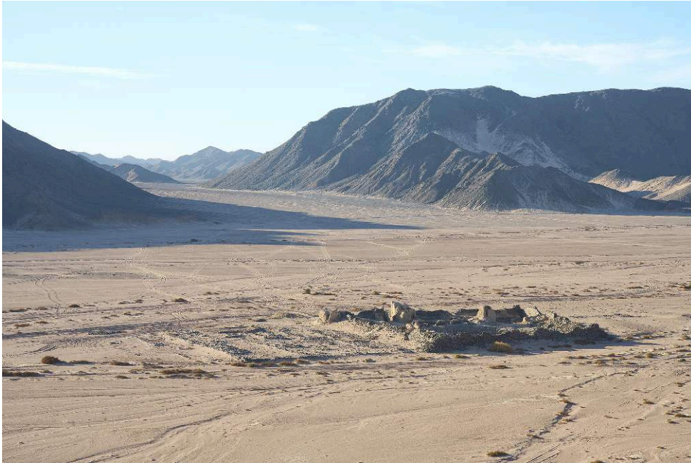
Fig. 6. Deir el-Atrash vu depuis le nord (M. Kačičnik).