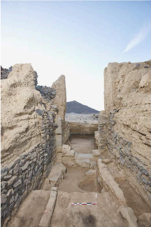
Fig. 7. Système d'entrée de Deir el-Atrash vu depuis l'intérieur.