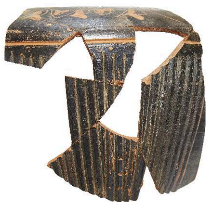
Fig. 10. Hydrie importée découverte dans le secteur 33 de Ghozza (M. Kačičnik).