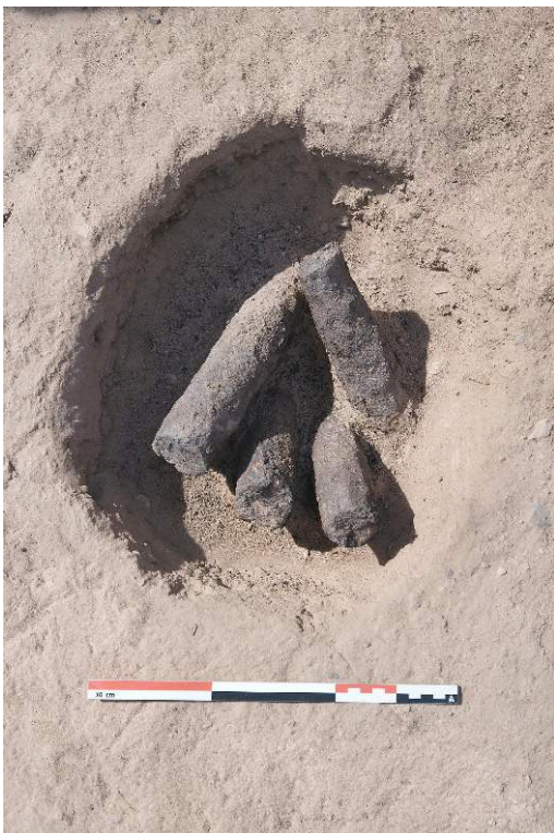
Fig. 3. Lingots ou pilons en fer mis au jour dans la pièce 11 du secteur 33 de Ghozza (B. Redon).