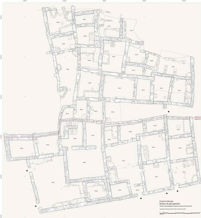
Fig. 4. Plan des secteurs 43 et 44 de Ghozza (P. François).