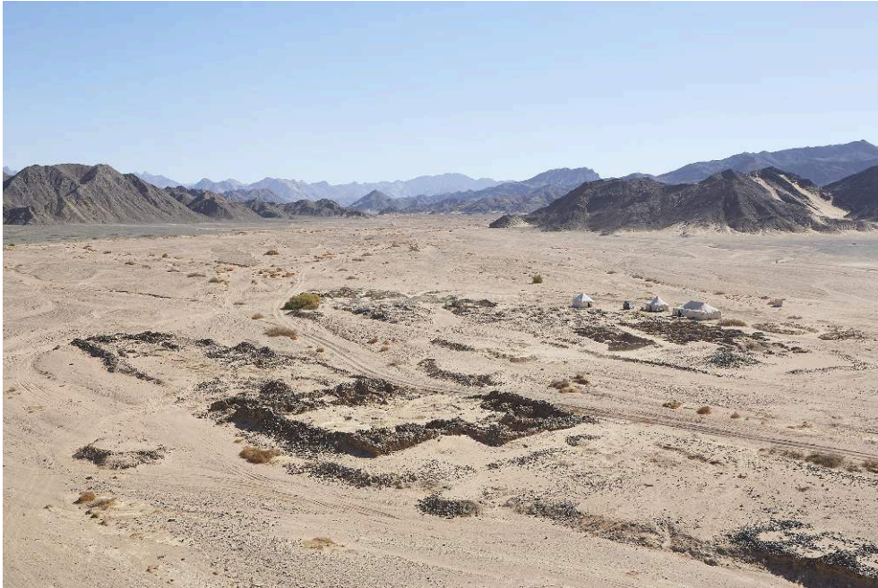
Fig. 1. Vue du fortin romain et du village hellénistique de Ghozza depuis l'ouest-nord-ouest.