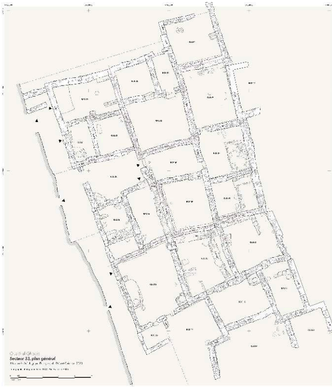
Fig. 2. Plan du secteur 33 de Ghozza (P. François).