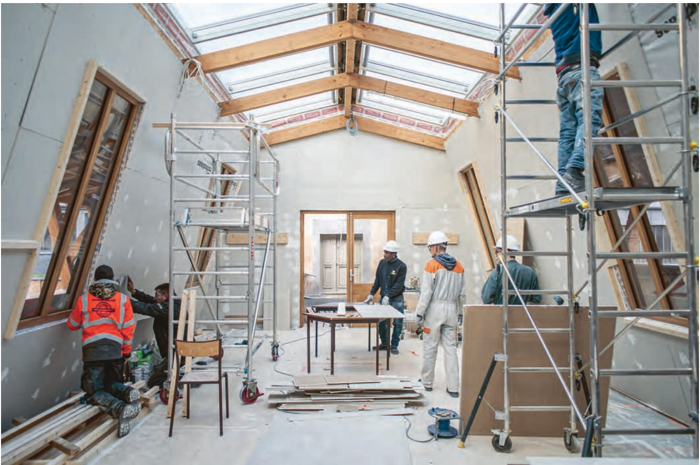
Fig. 8 Chantier d'insertion pour l'aménagement intérieur du foyer, encadré par les organismes de formation l'AFPA et le GRETA. Hôtel Pasteur, Rennes, 2020.