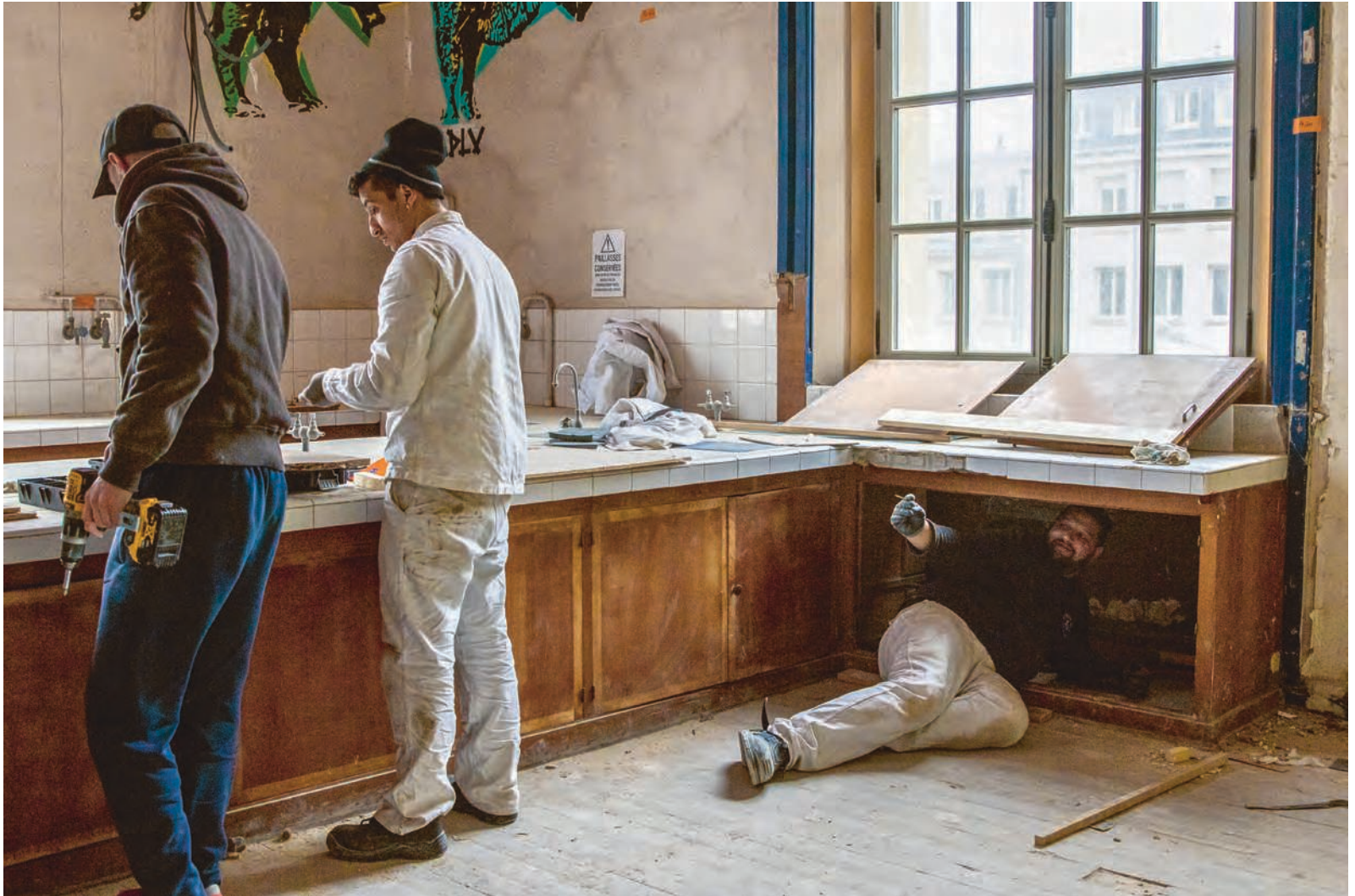
Fig. 9 Rénovation des paillasses encadrée par l'association Les Compagnons Bâtisseurs. Hôtel Pasteur, Rennes, 2020.