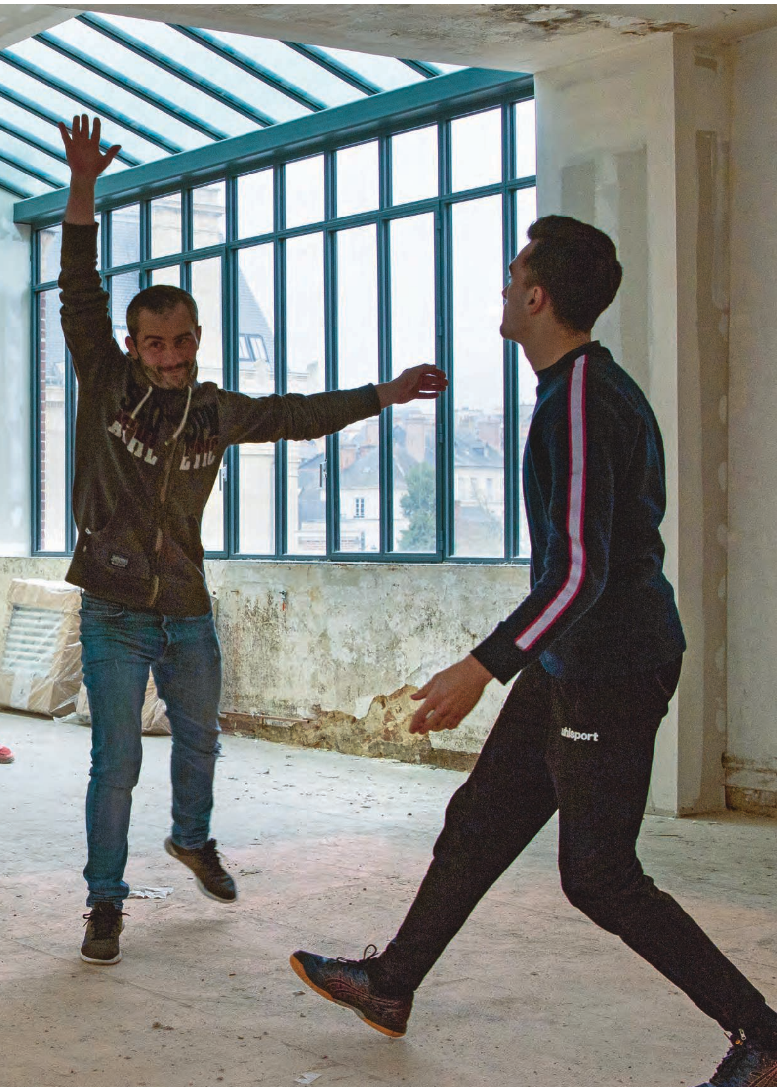
Fig. 4 Séance de badminton organisée pendant le chantier par l'association Breizh Insertion Sport, au dernier étage de l'aile sud, Hôtel Pasteur, Rennes, 2020.