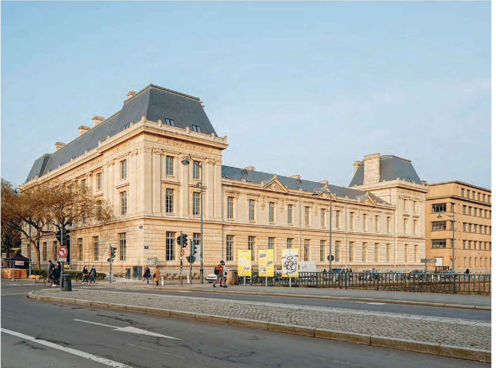
Fig.1 Hôtel Pasteur depuis le pont Pasteur, Rennes, 2021.