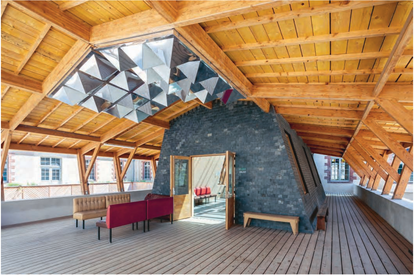
Fig. 7 Entrée nord du foyer avec le luminaire en réemploi de Skydome confectionné par Pierre-Thomas Deillon et les façades extérieures en tuiles réemployées. Hôtel Pasteur, Rennes, 2021.