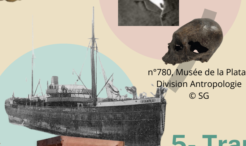
n°780, Musée de La Plata Division Anthropologie