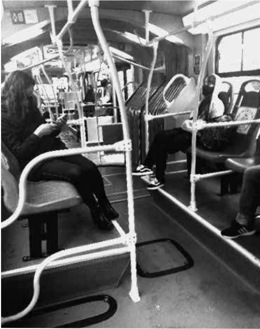
Figura 2 – Medidas contra la propagación del Covid-19 en el transporte público

Interior del bus «Transmilenio» que presta el servicio sur-norte por la Avenida Caracas, Bogotá