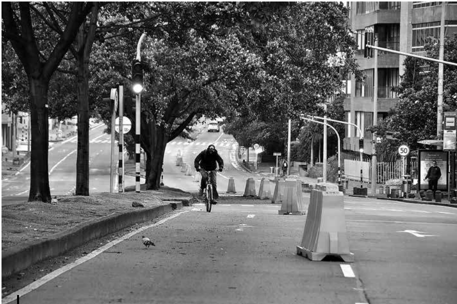
Figura 3 – Corredores exclusivos para bicicletas en tiempos de pandemia

Fotografía tomada en Carrera 7ma con Calle 81 (zona central de Bogotá)