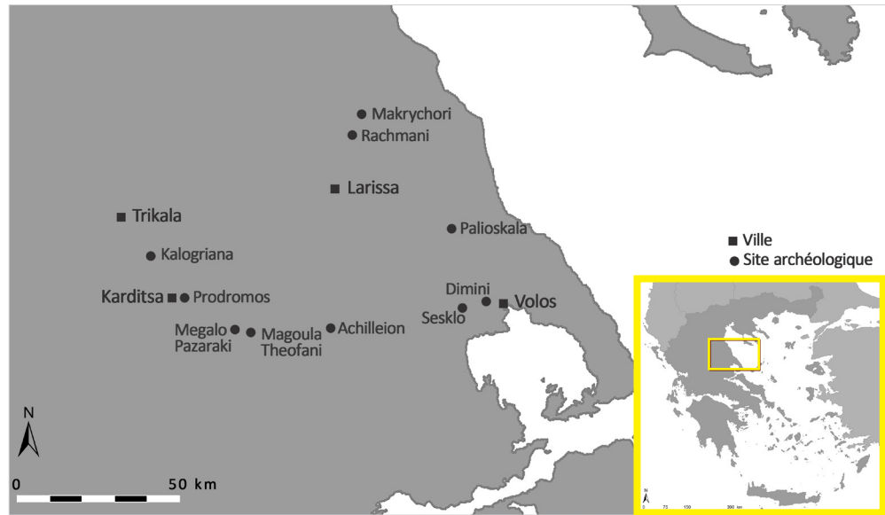
Fig. 4. Carte de la Thessalie avec les sites de provenance des figurines étudiées.