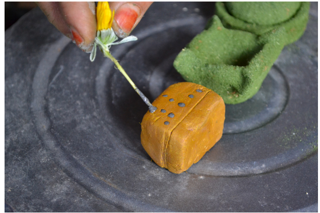
Fig. 2. Réalisation des motifs avec la hampe d'une fleur (Douar Ouaraben, région de Tiznit, 2016).

groupes de joueurs et des joueuses, les enfants de l'Anti-Atlas se veulent aptes à monter des projets collectifs d'un niveau technique souvent assez exigeant, qui relèvent de toute une tradition ludique, voire d'une culture enfantine à part entière. C'est pour cela que la fabrication des jouets – comme toute activité ludique – se déroule loin de l'univers des adultes, en général sans leur intervention, dans des endroits peu fréquentés que les enfants s'approprient au moins pour un certain temps. Des terrains « vides », les rivières saisonnières ( oueds ) à proximité des villages, des coins sombres des espaces domestiques ou bien des endroits « inertes » de l'espace public font partie des lieux qu'ils choisissent pour fabriquer leurs jouets, les transformant à travers leurs activités en des « ateliers ludiques ».