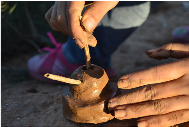
Fig. 1. Façonnage de la meule courante (avec son manche fait en bois) d'un moulin à bras rotatif (Douar Ouaraben, région de Tiznit, 2016).