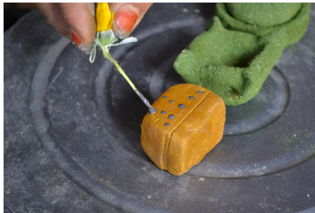
Fig. 2. Réalisation des motifs avec la hampe d'une fleur (Douar Ouaraben, région de Tiznit, 2016).

groupes de joueurs et des joueuses, les enfants de l'Anti-Atlas se veulent aptes à monter des projets collectifs d'un niveau technique souvent assez exigeant, qui relèvent de toute une tradition ludique, voire d'une culture enfantine à part entière. C'est pour cela que la fabrication des jouets – comme toute activité ludique – se déroule loin de l'univers des adultes, en général sans leur intervention, dans des endroits peu fréquentés que les enfants s'approprient au moins pour un certain temps. Des terrains « vides », les rivières saisonnières ( oueds ) à proximité des villages, des coins sombres des espaces domestiques ou bien des endroits « inertes » de l'espace public font partie des lieux qu'ils choisissent pour fabriquer leurs jouets, les transformant à travers leurs activités en des « ateliers ludiques ».