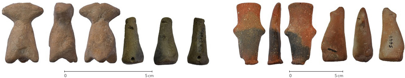
Fig. 5 (ci-bas). Figurines néolithiques de formes schématiques provenant de différents sites thessaliens.

de la petite plastique du Néolithique thessalien n'est pas incompatible avec une fabrication enfantine. De cela témoignent les formes schématiques, simples à reproduire, de plusieurs pièces (fig. 5) ou bien le haut niveau d'hétérogénéité granulométrique qui caractérise certaines pâtes employées et qui renvoie, très probablement, à une exploitation moins normée d'argiles locales 2 . De même, l'absence fréquente de décor, tout comme une ornementation plastique ou en creux souvent rudimentaire, les surfaces non-traitées ou juste lissées, souvent attestées, aussi bien que la variation colorimétrique de la surface de plusieurs exemplaires évoquant une atmosphère de cuisson mal contrôlée semblent renforcer l'hypothèse selon laquelle des jeunes fabricants s'impliquaient, activement, dans les activités idoloplastiques de la Thessalie.