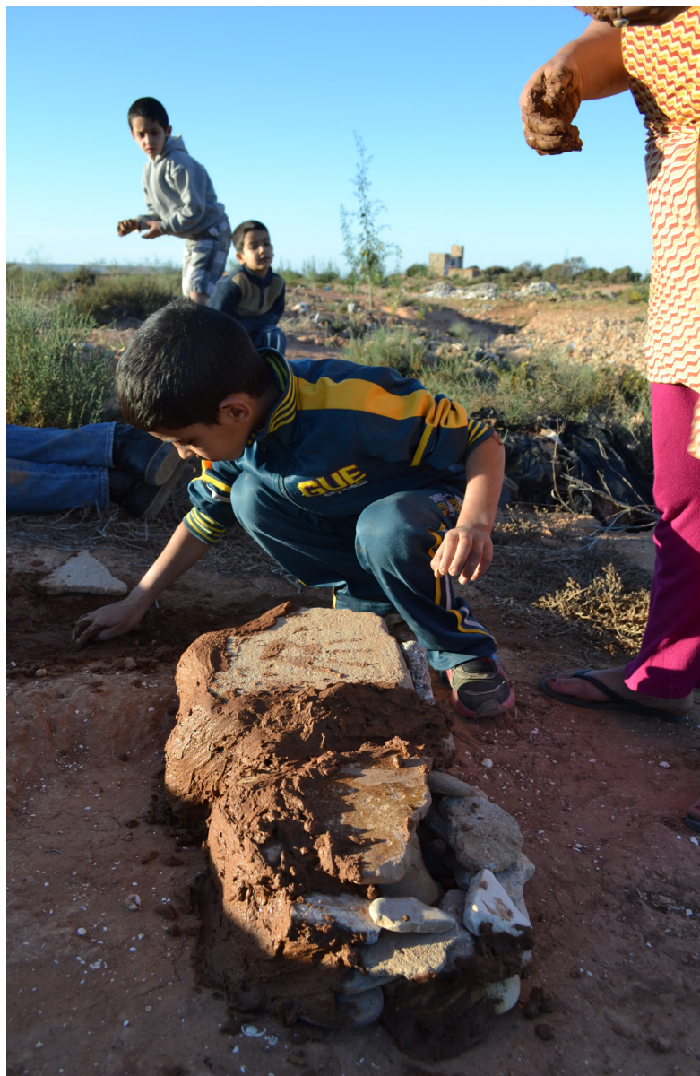
Fig. 3. Construction de deux taghouni l'un à côté de l'autre (Douar Ouaraben, région de Tiznit, 2016).

Néanmoins, comme le four et, en général, l'espace domestique sont interdits aux jeux des enfants, ces derniers sont souvent contraints de fabriquer leur propre construction thermique. Il s'agit d'une structure circulaire assez simple, montée en pierres aplaties puis revêtue de terre à bâtir et couverte avec une grande pierre plate une fois que les jouets ont été posés sur la braise. Cette structure nommée taghouni (fig. 3) ne dépasse pas 130 cm de diamètre et