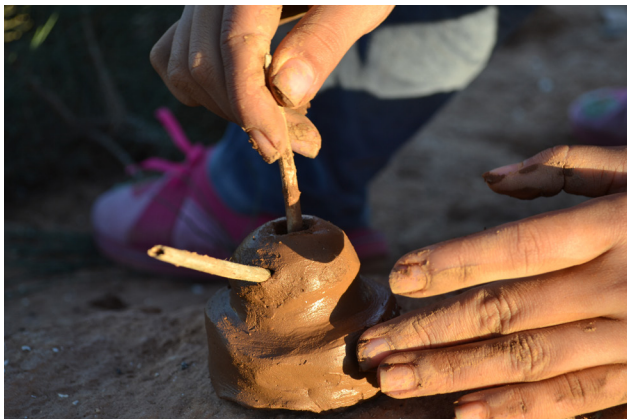
Fig. 1. Façonnage de la meule courante (avec son manche fait en bois) d'un moulin à bras rotatif (Douar Ouaraben, région de Tiznit, 2016).