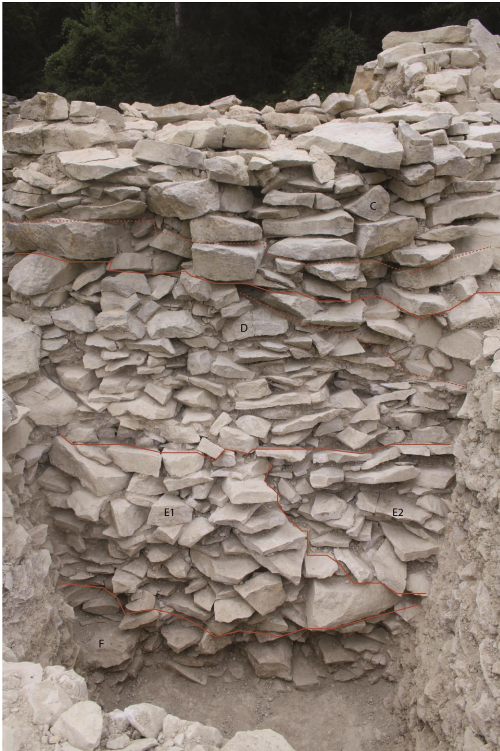
Fig. 2 - Quelques unes des sections de paroi identifiées au sein de l'élévation de l'alvéole c54b, à l'extrémité orientale du tumulus C de Péré.