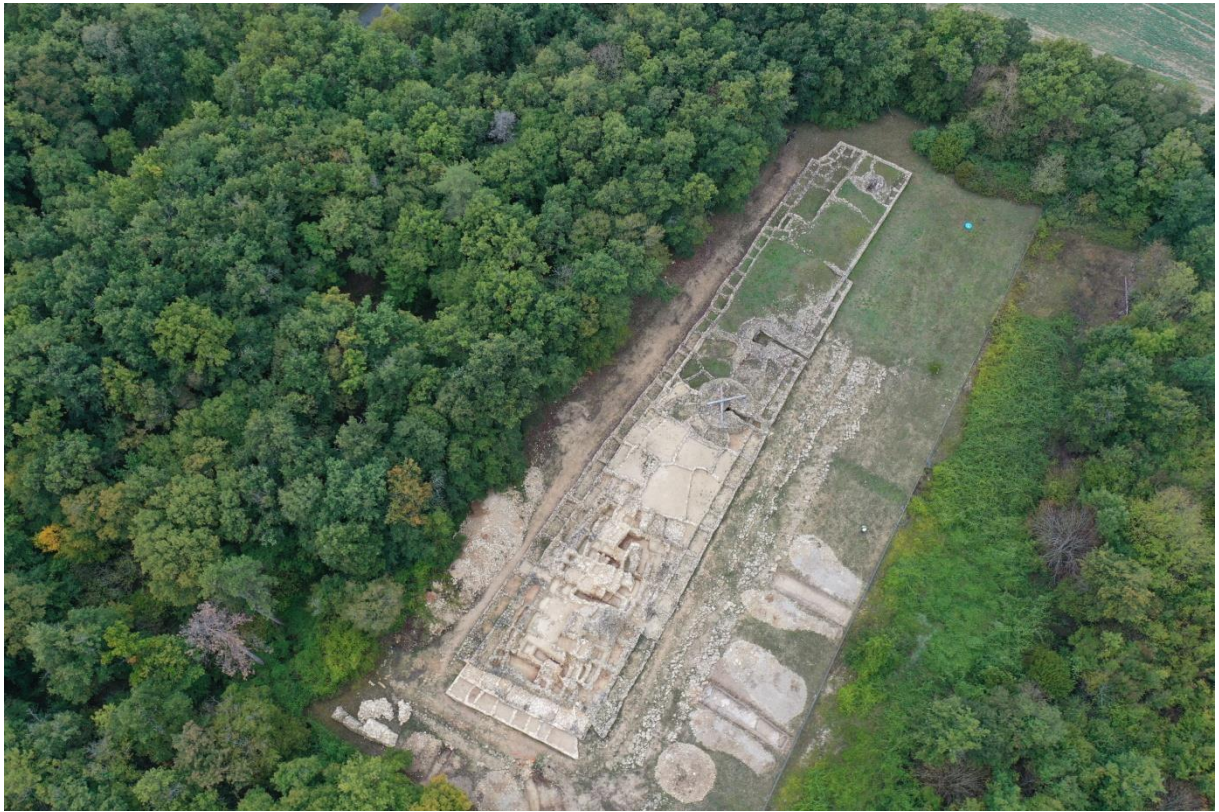
Fig. 1 - Le tumulus C de Péré à Prissé-la-Charrière (Plaine d'Argenson, Deux-Sèvres) à l'issue de la dernière campagne de fouilles, en 2020.