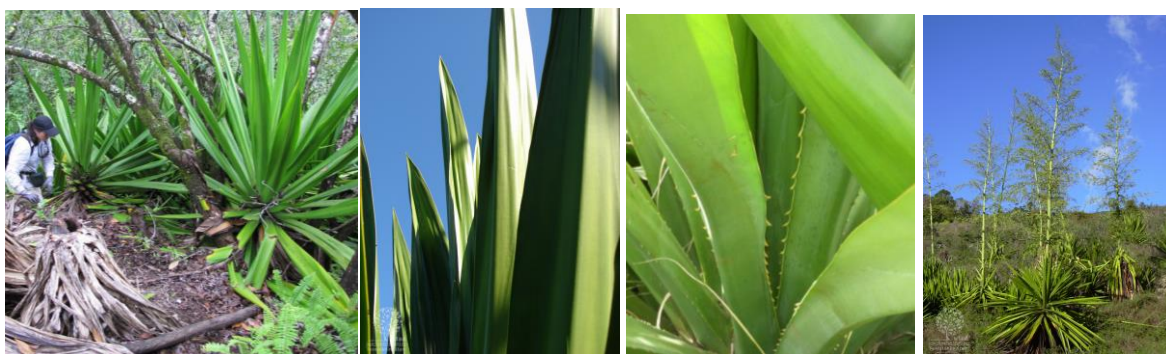
Figure 1 : Photos de Furcraea foetida et de sa hampe florale.

Furcraea foetida , aussi connu sous le nom de choca vert à La Réunion, est une espèce de plante succulente pérenne originaire d'Amérique centrale. Caractérisée par sa grande hampe florale qui peut s'élever à plusieurs mètres et par ses longues feuilles de couleur vert vif terminées par une épine brune, cette plante se reproduit principalement de manière végétative à travers des bulbilles. Cette méthode de reproduction facilite sa dissémination rapide, contribuant ainsi à son caractère invasif.