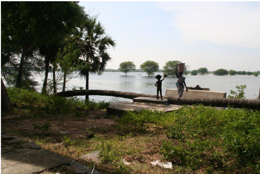
Photo 2 : « Tank » ou étang semi-endigué de l'arrière-pays de Pondichéry. La vanne au centre de la photo contrôle le flux d'eau à délivrer aux canaux en aval. Le remplissage de l'étang est saisonnier : six mois plus tard il est à-sec. (Photo : O. Aubriot, décembre 2005)