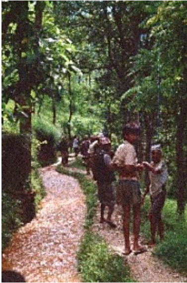
Photo 3 : Canal d'irrigation à flanc de montagne au Népal. Les irrigants reviennent d'une séance de maintenance du canal qui avait été bouché par un petit glissement de terrain (d'où la couleur boueuse de l'eau).