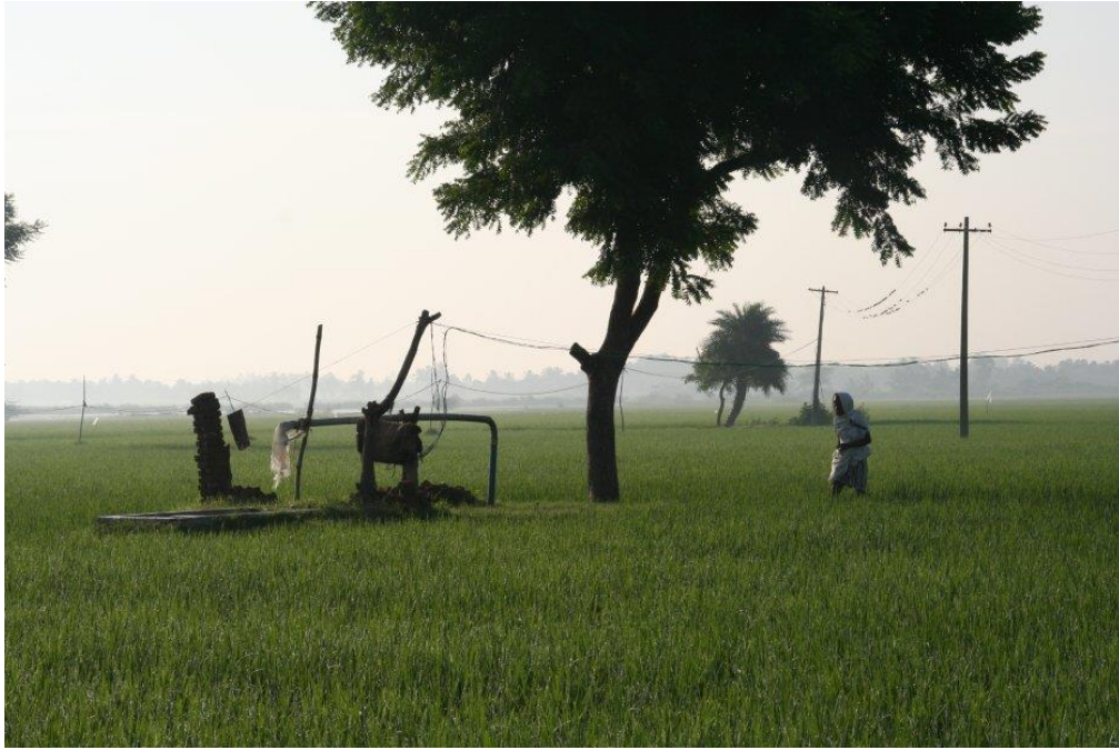
Photo 5 : Un homme se dirigeant vers le forage, pour le mettre en route et irriguer les rizières. Tamil Nadu (Inde du Sud). (Photo O. Aubriot, nov. 2005)