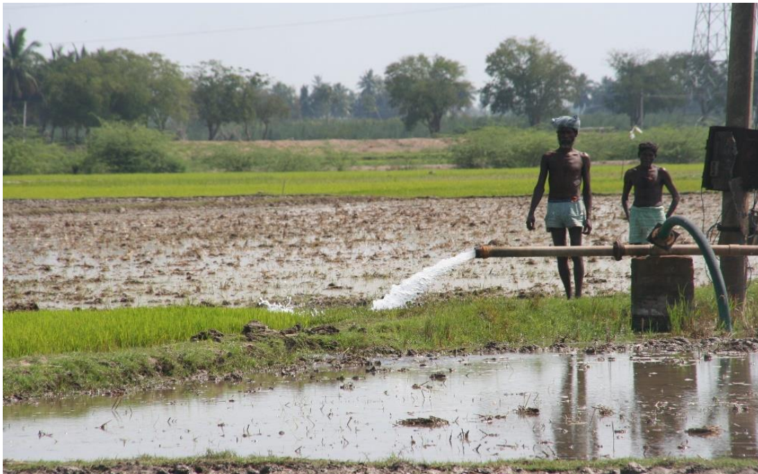
Irrigation par eau souterraine à Pondichéry, Inde du Sud.

Romain VALADAUD – Post doctorant IRD UMR G-Eau