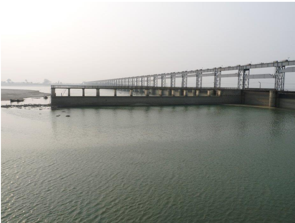
Photo 4 : Le barrage de la Koshi, localisé au Népal à la frontière avec l'Inde, sert à réguler le flux de la rivière pour éviter les inondations et à dévier l'eau pour l'irrigation de terres situées essentiellement en Inde. Le barrage est d'ailleurs géré par les ingénieurs indiens.