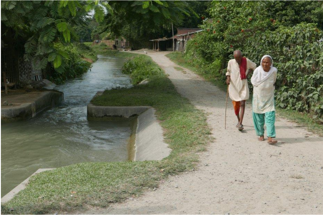
Photo 6 : Les branches de canaux étatiques circulent au milieu de villages, ici dans la plaine du Népal, dans le district de Sunsari