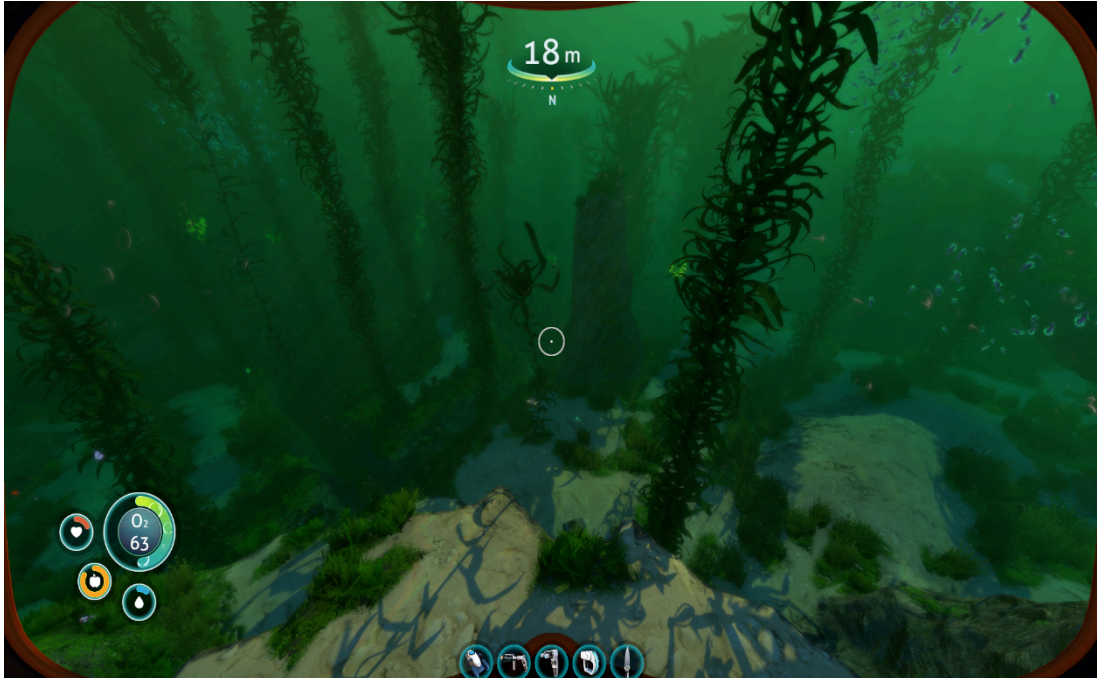
(Figure 1.) Capture d'écran à la première personne du jeu Subnautica , on peut voir en bas à gauche des indicateurs liés à la santé, à la faim, à la soif et à l'oxygène du personnage. Au milieu en bas sont situés des indicateurs d'inventaire. En premier plan on peut voir un environnement simulé en 3D comprenant végétation, géomorphologie et faune.

température, la profondeur, et la géomorphologie et par des attributs écologiques comme la faune et la flore. Ainsi, les choix économiques auxquels sont confrontés un joueur de Subnautica et un Homo sapiens du Paléolithique supérieur sont sensiblement les mêmes à la différence que le premier évolue dans un océan et l'autre dans une « steppe à mammouth » par exemple.