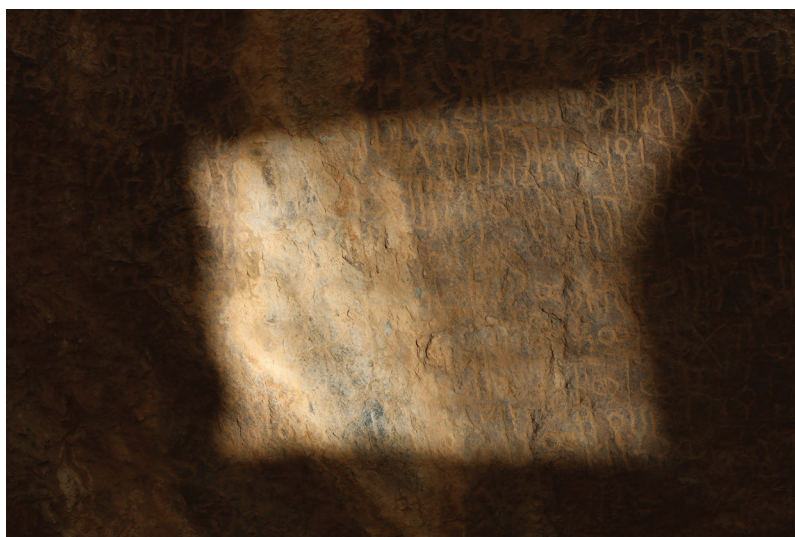
FIG. 3. – Photographie rapprochée prise avec la lumière réfléchie d'un miroir.