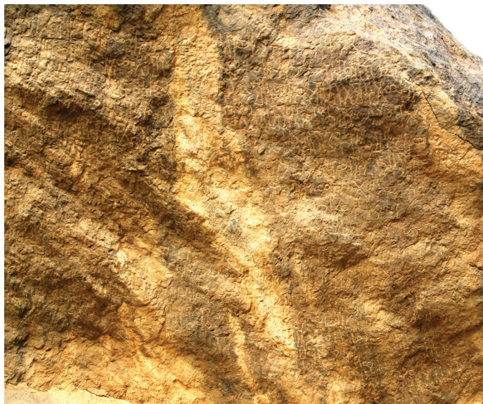
FIG. 4. – L'inscription Ma'sal 3, vue du côté droit.