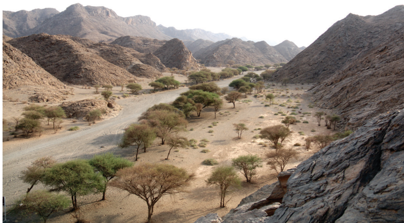
FIG. 7. – Vue du wādī Ma'sal.

Malgré l'apparence modeste de l'endroit, Ma'sal était évidemment un lieu important pour le royaume de Ḥimyar. On peut même affirmer, comme Ch. Robin l'a souligné, que Ma'sal était « le siège du pouvoir ḥimyarite en Arabie centrale 13 ». Cela est illustré par la présence des autres inscriptions sudarabiques royales qui ont été gravées sur les façades des rochers, tout particulièrement les deux autres inscriptions historiques déjà mentionnées, Ma'sal 1 (fig. 8) et Ma'sal 2 (fig. 9). Découverts en 1948, ces deux textes ont été vus, copiés et photographiés en 1952 par l'expédition belge Philby-Ryckmans-Lippens 14 . La mission belge releva également d'autres inscriptions courtes et graffitis gravés en contrebas à gauche de ces textes historiques (Ry 447-454, fig. 10).