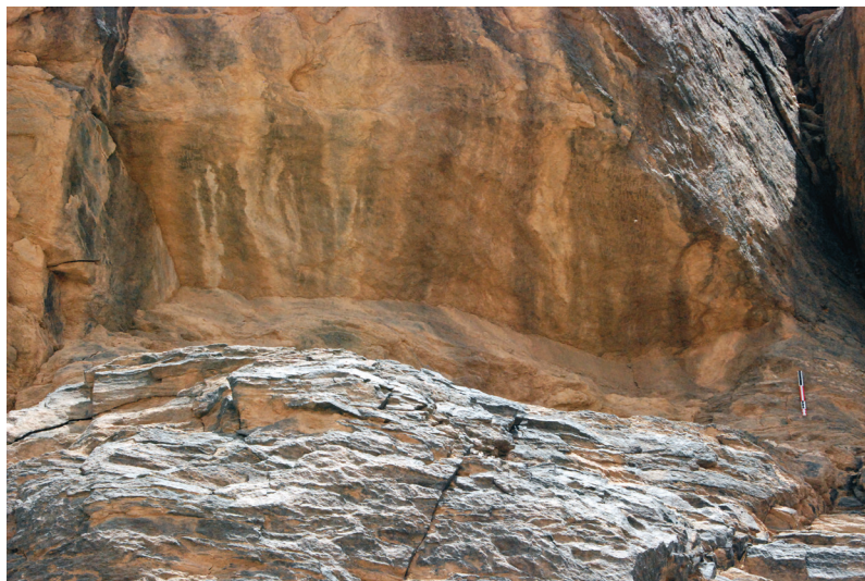
FIG. 2. – L'inscription Ma'sal 3, vue d'ensemble.