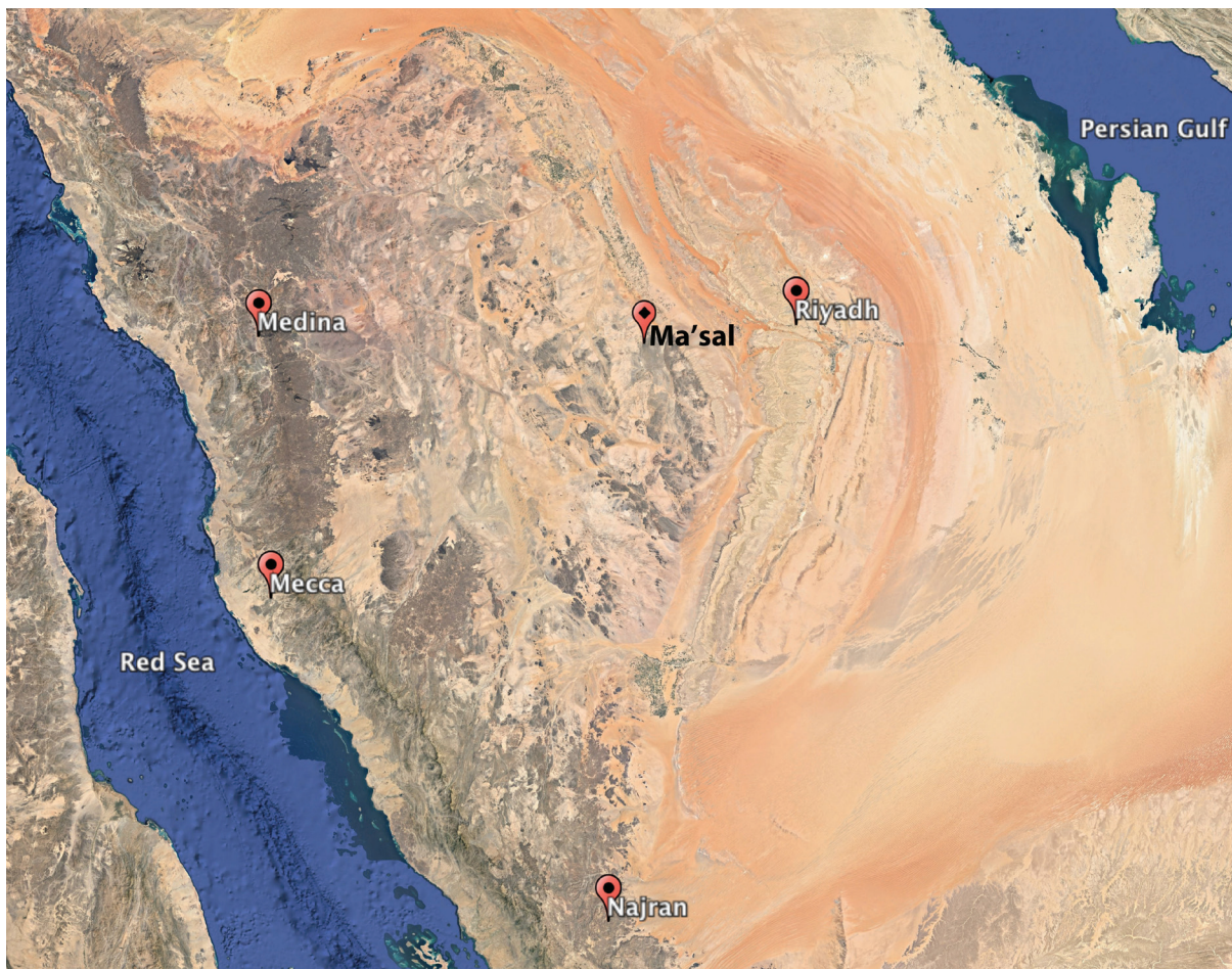
FIG. 1. – Carte de l'Arabie saoudite avec le site de Ma'sal.