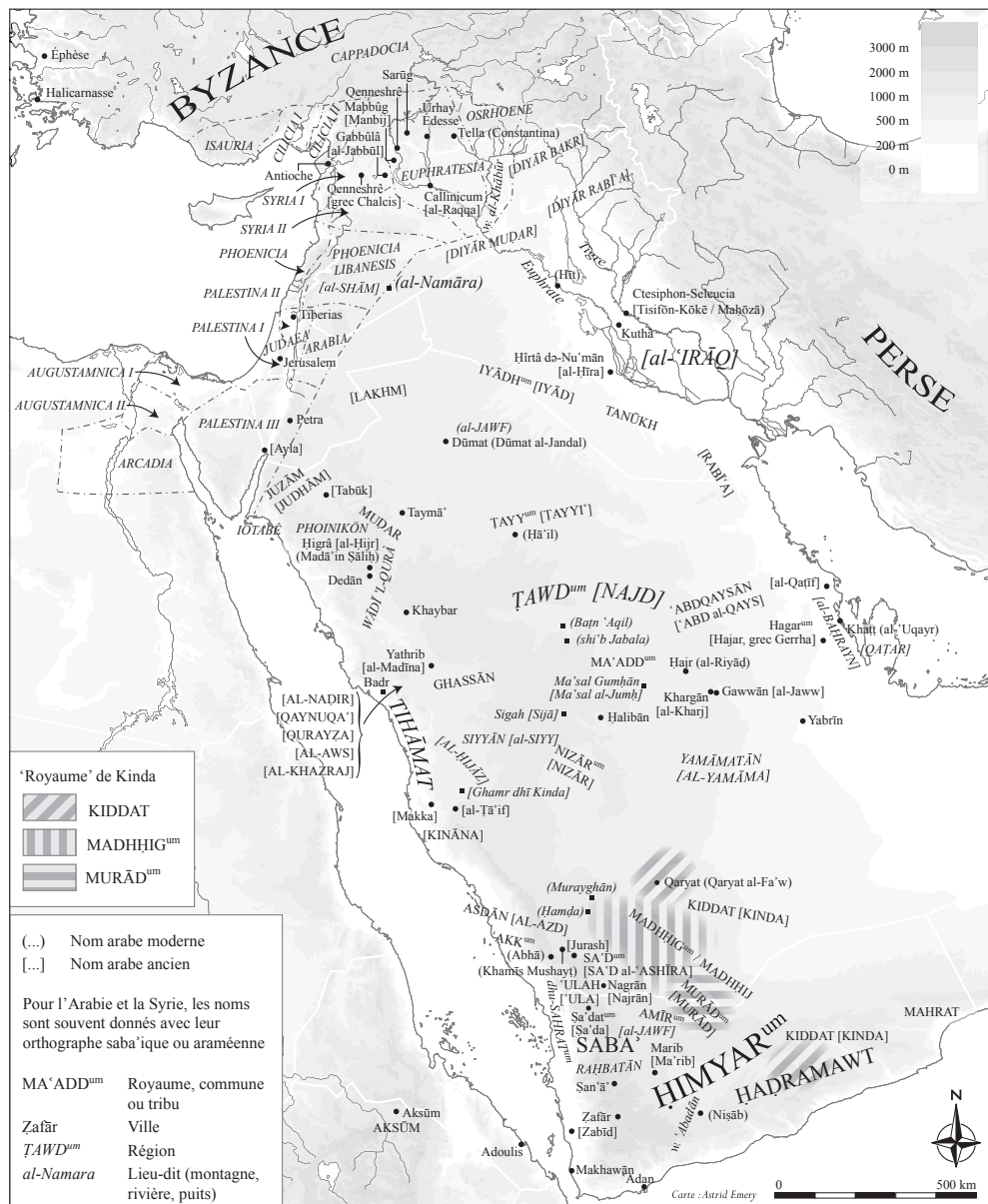
FIG. 6. – Carte de l’Arabie au v e -vi e siècles ap. J.-C. (© Ch. J. Robin).