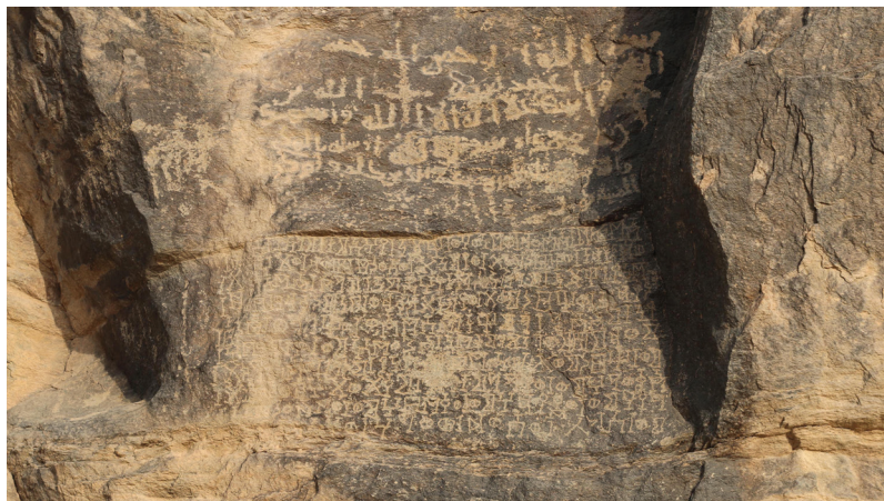
FIG. 8. – L'inscription Ry 509 = Ma'sal 1 et l'inscription arabe avec une croix au milieu.