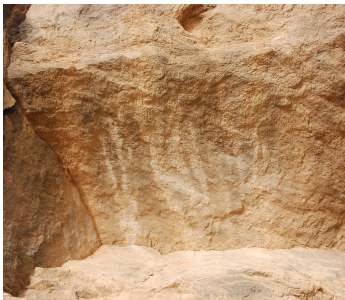
FIG. 5. – L'inscription Ma'sal 3, vue du côté gauche.