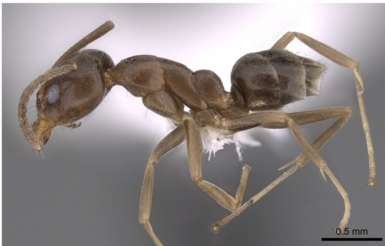
Figure 1. Linepithema humile (MAYR, 1868). Ouvrière de profil. Spécimen CASENT0281314 Antweb. https://www.antweb.org

Dans certaines régions du globe, l'espèce est tolérante aux températures plus basses comprises entre 9,8 et 13,5 °C (RUSSEL COLE et al. , 1992) 2 et s'accommode de variations hygrométriques plus importantes que les autres espèces (MENKE & HOLWAY, 2006). À la Réunion, qui réunit tous ces facteurs abiotiques, elle pourrait donc facilement s'y développer (BLARD, 2006). Une fois répandue, son éradication serait alors quasi-impossible. Quant aux méthodes de contrôle, elles s'avèrent coûteuses et souvent inefficaces (ANGULO et al. , 2022). Nous ne savons pas à ce stade si cette implantation reste localisée ou d'ampleur, mais la colonie d'origine nécessiterait une destruction des nids selon la méthode inspirée d'INOUE et al. (2015).