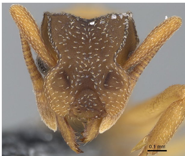
Figure 2. Cyphomyrmex minutus MAYR, 1862. Ouvrière, tête vue de face. Spécimen CASENT0264753 Antweb. https://www.antweb.org

d'un isolat sur l'île de la Réunion intrigue et interroge car, à ce stade, c'est la seule région où cette espèce est connue en dehors du continent américain dont elle provient. Ce constat est étonnant car les Attini ne sont pas spécialement connus pour leur propension à coloniser de nouvelles régions aussi éloignées de leur territoire d'origine ( comm. pers. B. GUENARD, 2023). De ce point de vue, cette fourmi doit être considérée comme une espèce atypique et singulière au sein de l'entomofaune réunionnaise.