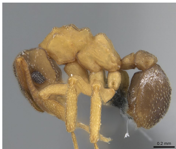
Figure 3. Cyphomyrmex minutus MAYR, 1862. Ouvrière de profil. Spécimen CASENT0264753 Antweb. https://www.antweb.org