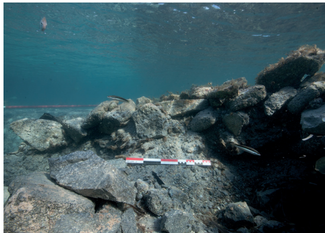
Fig.98b. Depuis le sud et côté « plage », vue sous-marine, après démontage, du remplissage interne de la structure constituée d'un amas de fragments pierreux.

Franca CIBECCHINI, Drassm, Marie-Brigitte CARRE, CCJ-CNRS. Laurent BOREL, CCJ-CNRS.