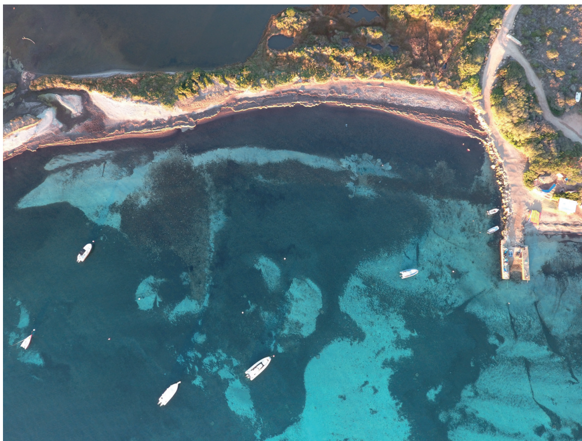
Fig.97. Vue aérienne zénithale de l'ensemble de la structure immergée de la plage de Piantarella montrant l'ouverture entre la « jetée » parallèle à la plage et l'esplanade (Cl. E. Botte, CCJ).

La campagne 2017 a permis de préciser l'étendue de la structure et d'en tracer un plan schématique. Les premières observations iraient dans le sens de l'hypothèse d'une construction, jetée ou môle, protégeant le fond de la baie contre les vents dominants. Cependant, sa profondeur (entre -80 et -90 cm max. au fond et -40 et -50 cm au sommet de la structure pour la partie parallèle à la côte ; entre -150 et -160 cm au fond et -100 cm au sommet de la structure à l'extrémité est), rapportée à la profondeur de la mer à l'époque romaine (-50 cm +/- 20 cm), ouvre des doutes sur sa fonction. Une analyse plus poussée de la géomorphologie de la