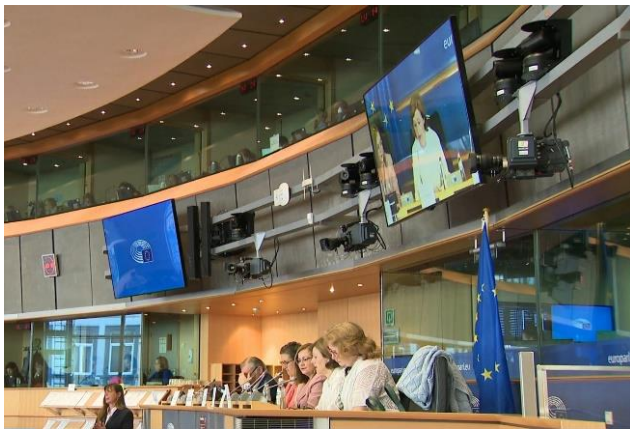
Figure 2. Audition des porteurs de l'ICE "Save Cruelty-free Cosmetics" au Parlement Européen le 25 mai 2023. Capture du montage vidéo disponible sur le site internet de la Commission. 23

promoteurs de l'ICE ont ainsi pu débattre de l'utilisation d'animaux notamment dans le cadre d'études de toxicité, avant que la Commission ne prépare et fasse connaître sa réponse. L'initiative a ensuite été débattue lors de la session plénière du Parlement européen du 10 juillet 2023. 26