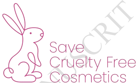
Figure 1. Logo de l'Initiative Citoyenne Européenne « Pour des cosmétiques sans cruauté - S'engager en faveur d'une Europe sans expérimentation animale »

Après l'Initiative Citoyenne Européenne (ICE) « Stop Vivisection » (C(2015)3773) 2 qui en 2015 enjoignait la Commission Européenne d'abroger la Directive 2010/63/UE 3 et de présenter une nouvelle proposition visant à éliminer la pratique de l'expérimentation animale, l'ICE « Save cruelty-free cosmetics – Commit to a Europe Without Animal Testing » 4 a recueilli 1 217 916 signatures pour exiger avant la fin de la législature une feuille de route visant l'élimination progressive de toutes les recherches sur animaux dans l'Union Européenne.