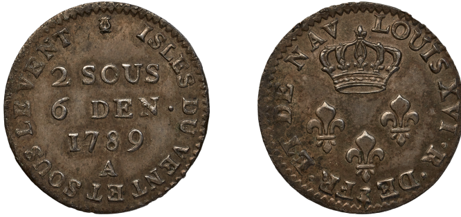
Figure 2 – Pièce de 2 sous 6 deniers pour les « Isles du Vent et Sous le Vent » (BnF, MMA, AA.ETR.66 ; × 4).