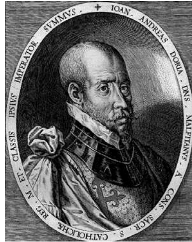
FIGG. 3-4 - Droit du ducaton de 1601 (BnF, MMA, ETR-Itl n° 2989) et portrait de Giovanni Andrea I Doria (gravure, Atrium heroicum Caesarum... , Augsburg, 1601-1602).