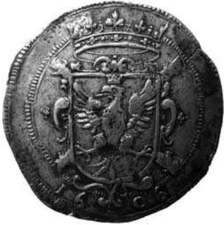
FIG. 5 - Le revers "au blason" du ducaton de 1606.