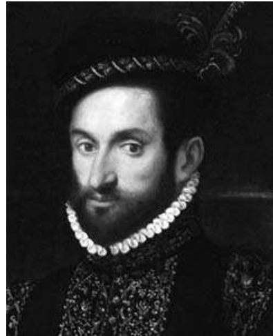
FIGG. 1-2 - Droit du ducaton de 1606 (BnF, MMA, ETR-Itl n° 2990) et portrait présumé d'Andrea II Doria (huile sur toile, Villa del Principe, Gênes).