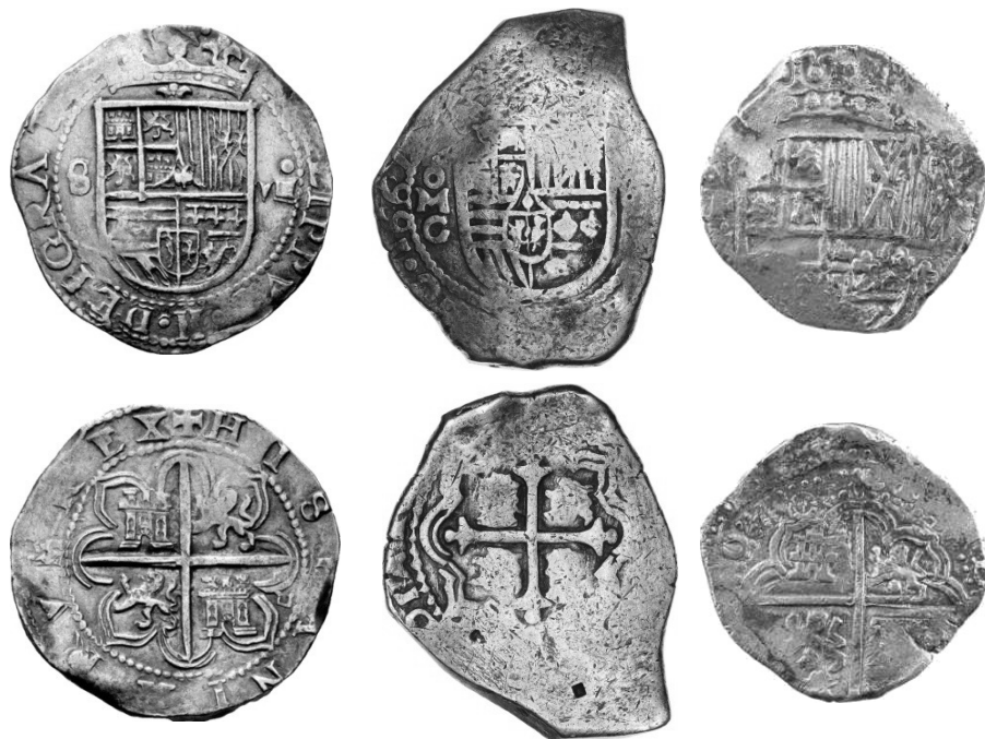
Piastre frappée à la fin du xv e siècle à Séville, de bon poids (27,22 g)