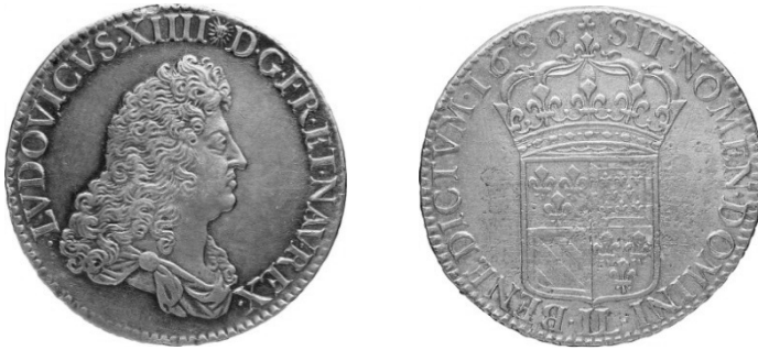
Figure 1 – L'un des premiers écus « de Flandre » frappé à Lille (IL) en 1686 (BnF, Côte 1465)

L'édit de septembre complétait et corrigeait en fait les décisions prises par l'arrêt du Conseil du roi du 28 juillet 1685 [29] , première étape timide au processus de réforme des monnaies en Flandre [30] , à savoir : poursuivre les rogneurs comme faux-monnaieurs, décréter les réaux légers à terme (au 1 er novembre), établir plusieurs changeurs pour les racheter (à Dunkerque, Ypres, Lille, Tournai, Valenciennes et Maubeuge), et ouvrir un atelier à Tournai pour les transformer en monnaie aux coins du roi, mais sur le pied des espèces du pays.