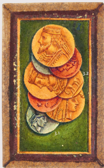
3 Carte de 8 de denier

BNF, Estampes et Photographie, RESERVE KH-167 (5 BIS, 173-176)-BOITE ECU