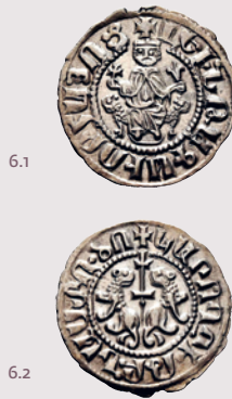
6.1 et 6.2 Double tram 35 (argent) de Levon I er , 1187-1199, Cilicie 36 Leu Numismatik AG, Web Auction 7, 22 février 2019, 1713 Au D, +ԼԵՒՈՆ ԹԱԳԱՒՈՆ ՀԱՅԱՍՅԱՆ (« Levon, roi des Arméniens ») entourant Levon I er trônant sur deux lions de face ; au R se poursuit l'inscription +ԿԱՐՈՂՈՒԻԹԲՆ ԱՍՏՈՄՅԱՆ (« par la volonté de Dieu ») autour de deux lions rampants appuyés face à face contre une croix. Reproduit sur le 10 de denier.

figure de la reine Érato illustrent quant à eux la fin de la dynastie et l'entrée du royaume d'Arménie dans le giron des rois parthes, en concurrence avec la puissance romaine. Là encore, les sources romaines évoquent les derniers soubresauts de la dynastie des Artaxiades, par exemple Strabon, Tacite et même Auguste lui-même dans ses Res gestae Divi Augusti 37 .