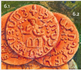
6 Carte de to de denier (détail) BNF, Estampes et Photographie, RESERVE KH-167 (5 BIS, 173-176)-BOITE ECU