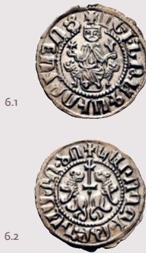
6.1 et 6.2 Double tram 35 (argent) de Levon I er , 1187-1199, Cilicie 36 Leu Numismatik AG, Web Auction 7, 22 février 2019, 1713 Au D, +ԼԵՒՈՆ ԹԱԳԱՒՈՆ ՀԱՅԱՍՅԱՆ (« Levon, roi des Arméniens ») entourant Levon I er trônant sur deux lions de face ; au R se poursuit l'inscription +ԿԱՐՈՂՈՒԻԹԲՆ ԱՍՏՈՄՅԱՆ (« par la volonté de Dieu ») autour de deux lions rampants appuyés face à face contre une croix. Reproduit sur le 10 de denier.

figure de la reine Érato illustrent quant à eux la fin de la dynastie et l'entrée du royaume d'Arménie dans le giron des rois parthes, en concurrence avec la puissance romaine. Là encore, les sources romaines évoquent les derniers soubresauts de la dynastie des Artaxiades, par exemple Strabon, Tacite et même Auguste lui-même dans ses Res gestae Divi Augusti 37 .