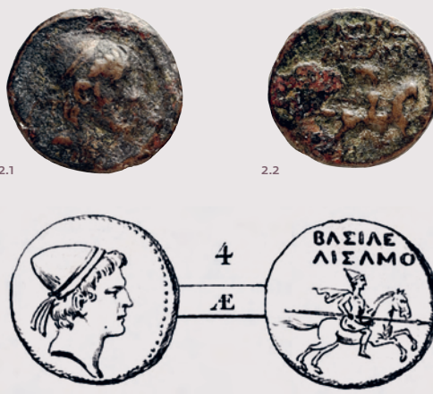
2.1 et 2.2 Bronze d'Arсамès, fils de Samos, roi de Sophène, vers 255-225 av. J.-C., Arménie 4

BNF, Estampes et Photographie, RESERVE KH-167 (5 BIS, 173-176)-BOITE ECU