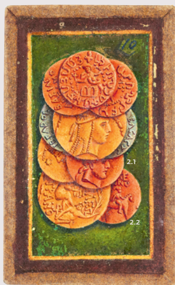
2 Carte de 10 de denier

BNF, Estampes et Photographie, RESERVE KH-167 (5 BIS, 173-176)-BOITE ECU