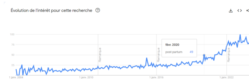
Figure 1 – Analyse Google trends pour le terme « post-partum »

La question de son accompagnement apparaît comme un problème public. Il a notamment intéressé les associations d'usagères puisqu'en 2022 le CIANE (Collectif Interassociatif Autour de la Naissance), avec le soutien financier de Santé Publique France, publie une enquête basée sur les témoignages de 8 500 femmes ayant accouché entre 2016 et 2021. Cette étude révèle que la majorité des femmes se sentent insuffisamment accompagnées après la maternité.