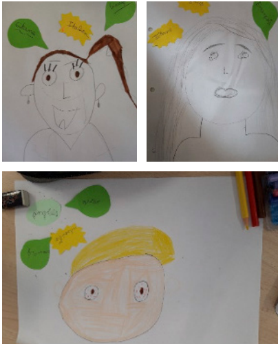
Figure 1 Des élèves pluriculturels