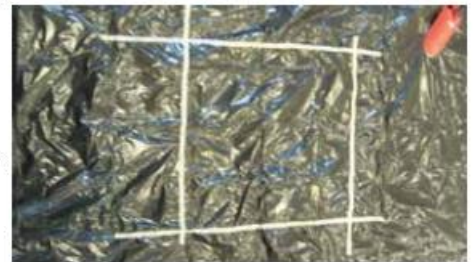
(1) Zone de mélange