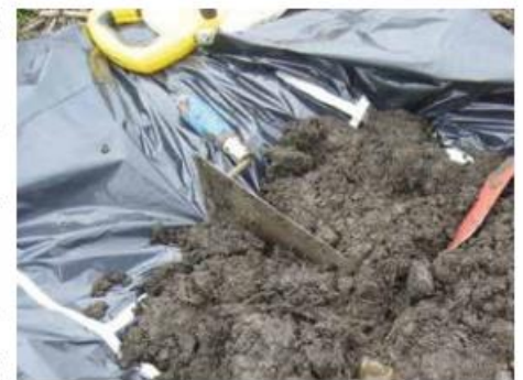
(2) Division en 4 du tas