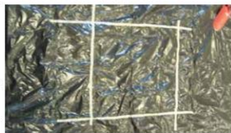
(1) Zone de mélange