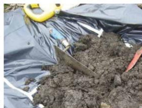
(2) Division en 4 du tas