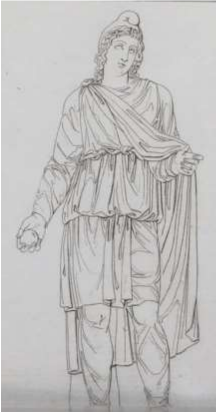
Fig. 4 : Charles-Paul Landon, Pâris, ou ministre de Mithras , Annales du Musée et de l'Ecole moderne des Beaux-Arts , Paris, Migneret, t. III, 1802, pl. 63, photo Gallica BNF.