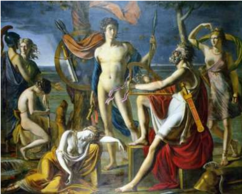
Fig. 8 : Paul Duquoylar, Ossian récitant ses poèmes , 1800, huile sur toile, 273x346, Musée Granet, Aix-en-Provence, photo : domaine public.

https://collections.louvre.fr/ark:/53355/cl010063138