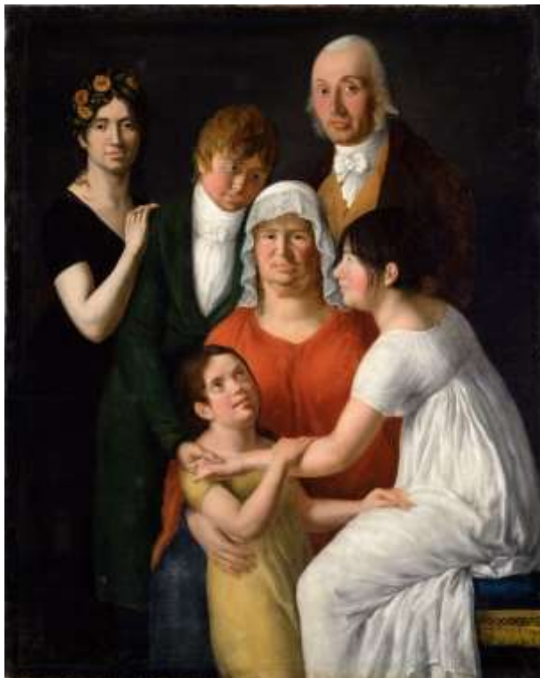
Fig. 10 : Attribué à Maurice Quay, Etude , vers 1800, Musée Granet, Aix-en-Provence, photo : CM.