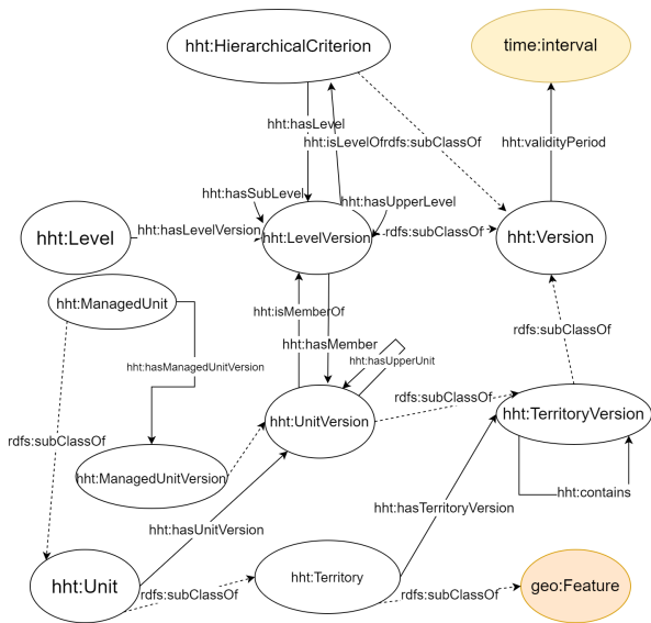
FIGURE 1 – Schema de l'ontologie HHT

décrit plus en détail dans [2]. HHT-Change propose une taxonomie de changements afin de matérialiser et qualifier les changements survenus entre deux versions de territoires. Elle distingue les changements individuels, n'affectant qu'un unique territoire, des changements composites, agrégeant de multiples changements individuels connexes pour leur attribuer un sens global.