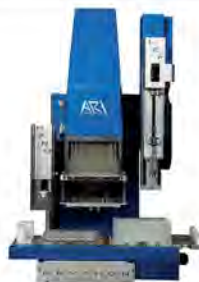
Crystal Gryphon LCP