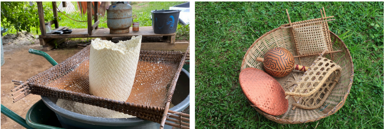
Figure 1. À gauche : utilisation du tamis pour la fabrication de la kassave 39 (Antecum-Pata). À droite : collection d'objets culturels miniatures (Cayenne).

L'immersion dans le terrain et notre expérience propre de celui-ci 36 , nous ont permis de constater la profusion d'objets culturels 37 dans l'intérieur des maisons du littoral guyanais. Qu'ils soient utilisés au quotidien comme objets usuels (poteries, paniers en vannerie, calebasses) ou qu'ils servent à décorer (souvent en miniatures), ils habitent les maisons en quantité 38 . Il convient de préciser que ces objets usuels ou de décoration donnent, par leur nombre, une grande place au graphisme vernaculaire dans l'environnement quotidien des Guyanais.