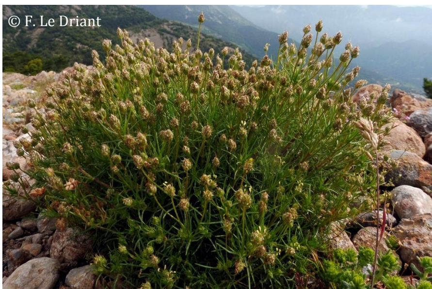
Figure 2 : Port buissonnant du plantain badasson

Un autre des adjectifs vernaculaires utilisés en français pour désigner ce plantain particulier est celui de « badasson », originaire de Haute-Provence, qui fait référence au mot « badasse », désignant un buisson ramifié avec une base ligneuse (Figure 2). Néanmoins, plusieurs espèces à port buissonnant sont qualifiées de « badasse », ce qui est à l'origine d'une possible confusion avec entre autres la dorycnie à cinq feuilles ( Lotus dorycnium L.), mais aussi des thyms, lavandes ou encore des cistes (Parard et al., 2023; Ubaud, 2021). La racine du mot « badasse » est dérivée en plusieurs adjectifs notamment « badasson » et « badassoun » dont les suffixes « on » et « oun » évoqueraient une intention affectueuse à une plante utile (Farina & Funari, 2020; Parard, 2018).