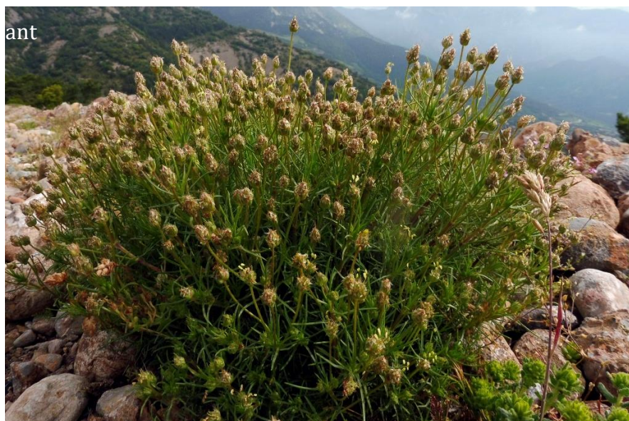
Figure 2 : Port buissonnant du plantain badasson

Un autre des adjectifs vernaculaires utilisés en français pour désigner ce plantain particulier est celui de « badasson », originaire de Haute-Provence, qui fait référence au mot « badasse », désignant un buisson ramifié avec une base ligneuse (Figure 2). Néanmoins, plusieurs espèces à port buissonnant sont qualifiées de « badasse », ce qui est à l'origine d'une possible confusion avec entre autres la dorycnie à cinq feuilles ( Lotus dorycnium L.), mais aussi des thyms, lavandes ou encore des cistes (Parard et al., 2023; Ubaud, 2021). La racine du mot « badasse » est dérivée en plusieurs adjectifs notamment « badasson » et « badassoun » dont les suffixes « on » et « oun » évoqueraient une intention affectueuse à une plante utile (Farina & Funari, 2020; Parard, 2018).