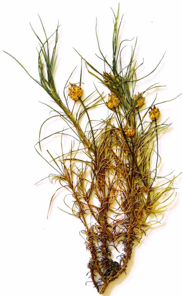
Figure 1 : Planche d'herbier de P. sempervirens (C. Baccati)

Parmi les plantains utilisés en médecine traditionnelle Provençale figure le plantain badasson (Figure 1), ou Plantago sempervirens Crantz, considéré comme une panacée contre les affections externes en Haute-Provence (Fournier, 2017; Lieutaghi, 1983). Tout comme les autres plantains, il est réputé dans les domaines vulnéraires, dermatologiques et anti-inflammatoires (Lieutaghi, 2006, 2009). L'ethnobotaniste Pierre Lieutaghi considère même que le plantain badasson illustre bien la capacité de la médecine traditionnelle à regrouper des plantes taxonomiquement proches par leurs usages et indications thérapeutiques, bien que leurs caractéristiques botaniques morphologiques ne permettent pas de les classer parmi les plantains à première vue (Lieutaghi, 2006).