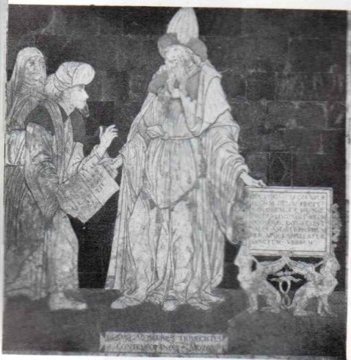
Hermes Mercurius Trismegistus : dallage de la cathédrale de Sienne.

«Car la liturgie est la mise en lecture, en pratique, en exégèse et en herméneutique du récit sacré, elle est une anti-histoire au même titre que l'œuvre d'art, selon Malraux, est un anti-destin ; anti-histoire, parce qu'elle préconise justement la «récitation» et la mise en œuvre du récit, et récupère le sens de ce récit pour chaque instant, pour chaque cycle temporel, pour chaque âme et chaque moment de cette âme, contre le fil de l'histoire, contre le déterminisme superstitieux des faits historiques et des événements aveugles qui conduisent les hommes et les empires, comme de vulgaires végétaux, à l'ascension, à la puissance, au déclin et à la mort.» La foi du cordonnier , pp. 39-40.