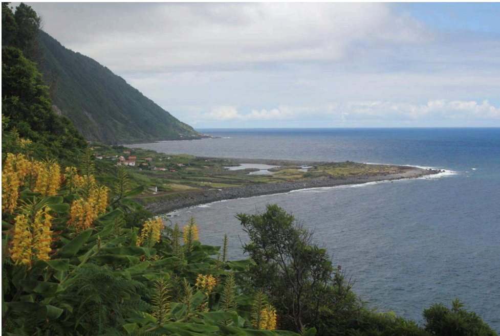
Photo 2 - Vue de la fajã dos Cubres vers le nord-ouest. Cliché : C. Portal, 2014.