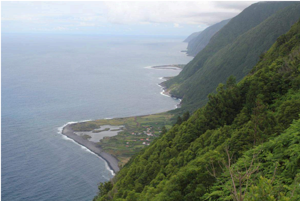
Photo 1 – Vue vers le sud-est de la fajã dos Cubres (au premier plan) et de la fajã da Caldeira do Santo Cristo.

(Caniaux 2019) et pouvant avoir trois origines différentes (voir les détails en figure 2). Le propos se focalise ici sur la fajã dos Cubres (38° 38' 27" N, 27° 58' 3" W), plate-forme détritique reconnue comme géomorphosite via , entre autres, la labellisation du géoparc mondial UNESCO des Açores en 2013. Dans ce contexte, elle est associée à la fajã da Caldeira do Santo Cristo, toutes deux distantes de 3 km (géosite SJO4, photo 1, figure 1). Ces deux fajãs montrent des caractéristiques très proches et sont les seules de l'archipel à posséder une lagune. Cette spécificité et leur proximité génétique – elles sont issues du même glissement de terrain – font qu'elles sont rarement évoquées individuellement bien qu'elles constituent toutes deux d'authentiques géomorphosites : au-delà des valeurs principales géologiques et géomorphologiques, les critères additionnels (écologique, socio-économique, culturel et éducatif) constituent des aspects importants de leur reconnaissance géopatrimoniale.