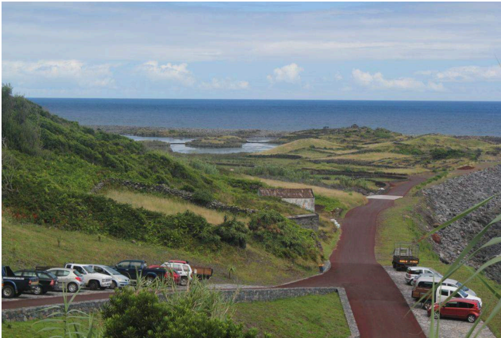
Photo 4 – Route d'accès et lagune orientale, vue vers le nord.

toponymique de la fajã dos Cubres est d'ailleurs due à la présence abondante d'une plante à petites fleurs jaunes, le « cubre » ( Solidago sempervirens L.).